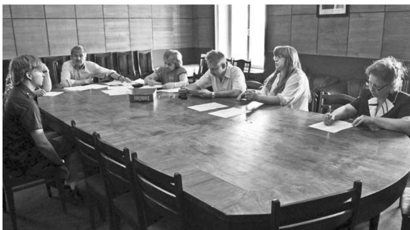
Творчая атэстацыя студэнтаў.

Вам сапраўды ў Літінстытуце ніхто не скажа, «як пісаць». Калі вы спытаеце — адкажуць, што ніхто не ведае і няма такой кнігі, дзе пра гэта можна прачытаць. «Выхоўвайце густ», «вучыцеся на добрых і дрэнных прыкладах», «вывучайце мову» і «пішыце паболей» — хто ж гэтага не ведае? Але менавіта так, крок за крокам, і адбываецца тут навучанне: пачынаючы са старажытных літаратур і латыні, стараславянскай мовы і дыялекталогіі... Вас нібыта ва ўсе бакі развіваюць (ва ўсе непрактычныя бакі, трэба зазначыць), вам сапраўды выходзяць густ, і на чацвёртым курсе, калі вы дойдзеце да гарача жаданай на першым стылістыкі, вы можаце раптам зразумець, што ўсё гэта ўжо адчуваецца падсвядома.