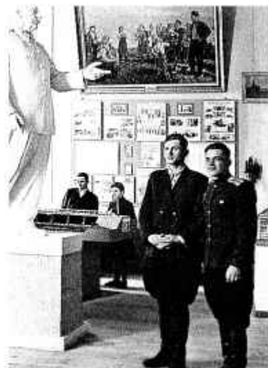
22. У экспазіцыі Магілёўскага абласнога краязнаўчага музея. 1951 г.