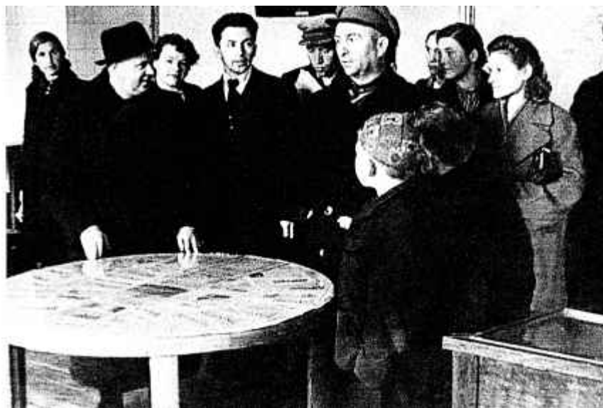
4. Адкрыццё экспазіцыі Белдзяржмузея гісторыі Вялікай Айчыннай вайны. 1944 г.