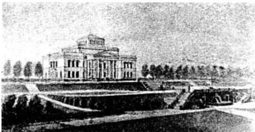
8. Будынак Дзяржаўнай карціннай галерэі БССР. Праект архітэктара М. І. Бакланова. 1949 г.