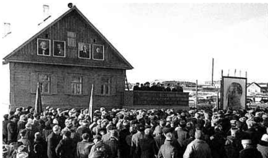
37. Адкрыццё Дома-музея I з'езда РСДРП. 1948 г.