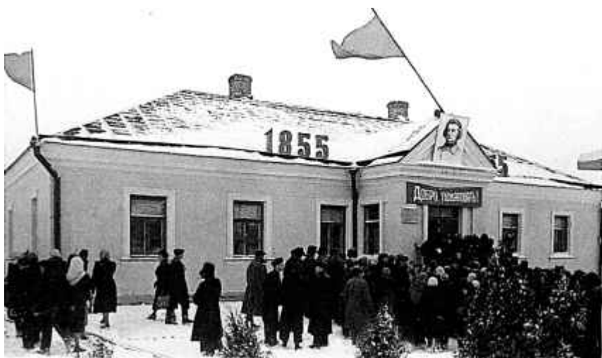
39. Адкрыццё Дома-музея А. Міцкевіча ў Навагрудку. 1955 г.