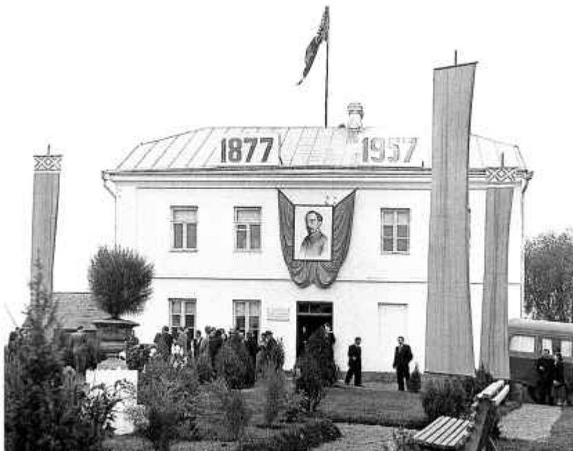
38. Адкрыццё Музея Ф. Э. Дзяржынскага. 1957 г.