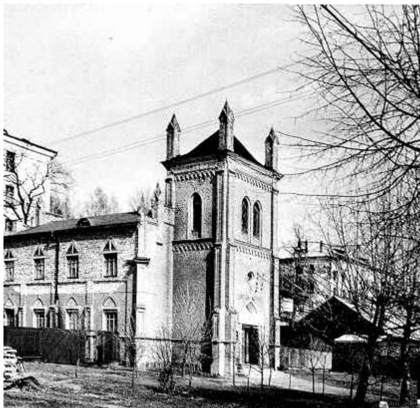
27. Будынак Полацкага раённага краязнаўчага музея. 1962 г.