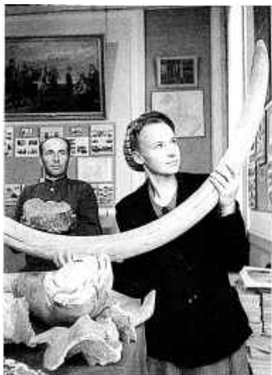
23. Супрацоўнікі Магілёўскага абласнога краязнаўчага музея аглядаюць рэшткі маманта. 1952 г.