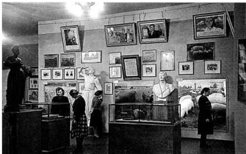
20. У экспазіцыі Гродзенскага гісторыка-археалагічнага музея. 1959 г.