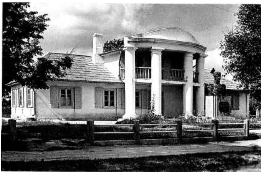
32. Будынак Ваўкавыскага ваенна-гістарычнага музея імя П. І. Баграціёна. 1953 г.