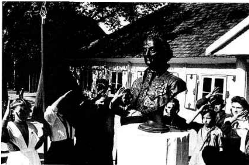
31. Школьнікі ля ўваходу ў Кобрынскі ваенна-гістарычны музей імя А. В. Суворова. 1950 г.