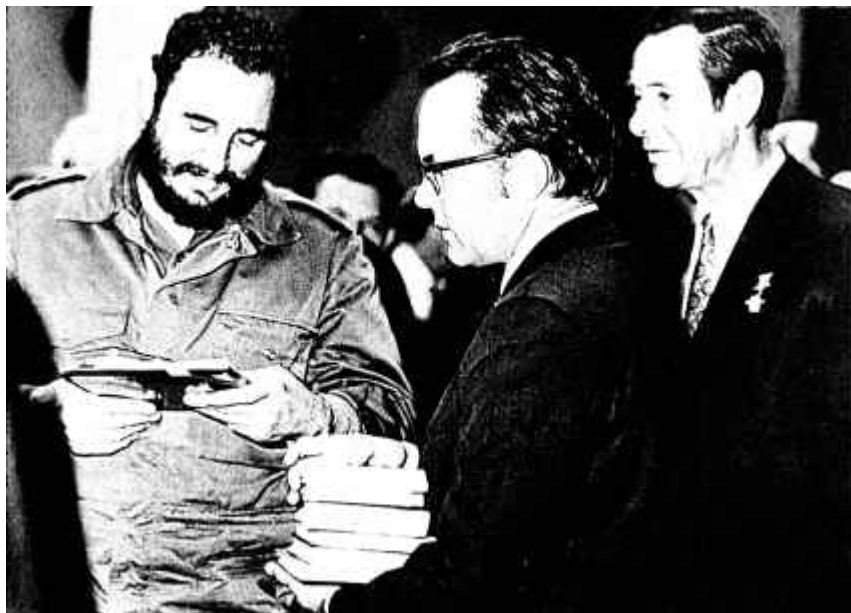
6. П. М. Машэраў і Ф. Кастра ў адной з залаў Белдзяржмузея гісторыі Вялікай Айчыннай вайны. 1972 г.