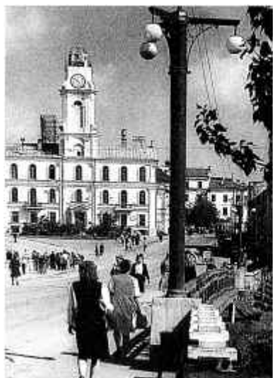
21. Будынак Віцебскага абласнога краязнаўчага музея. 1950 г.