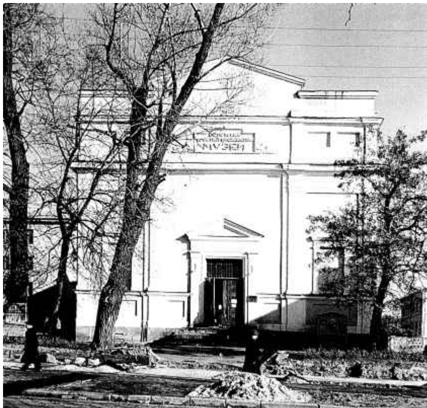
26. Будынак Брэсцкага абласнога краязнаўчага музея. 1968 г.