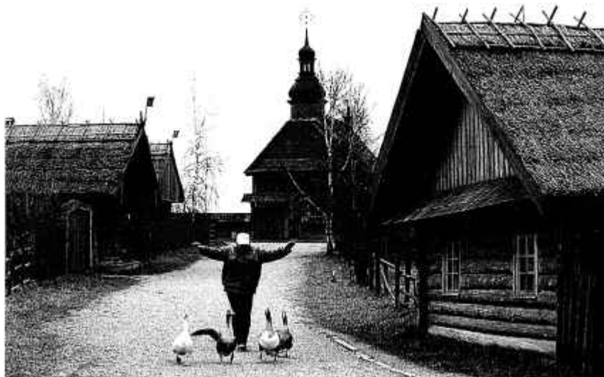
42. У Белдзяржмузеі народнай архітэктуры і побыту. 1991 г.