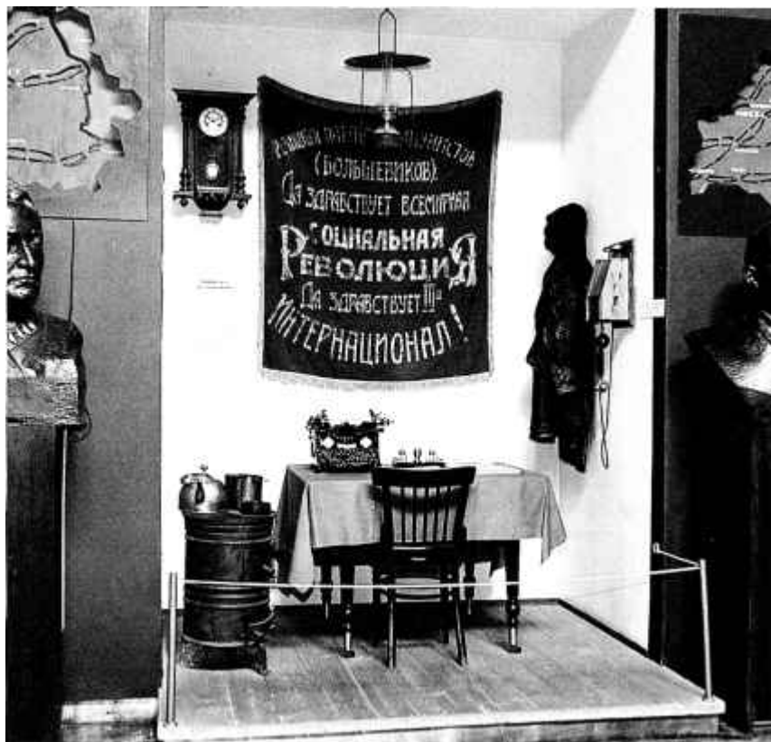
19. Фрагмент экспазіцыі Дзяржмузея БССР, прысвечанай рэвалюцыйным падзеям у Мінску. 1988 г.