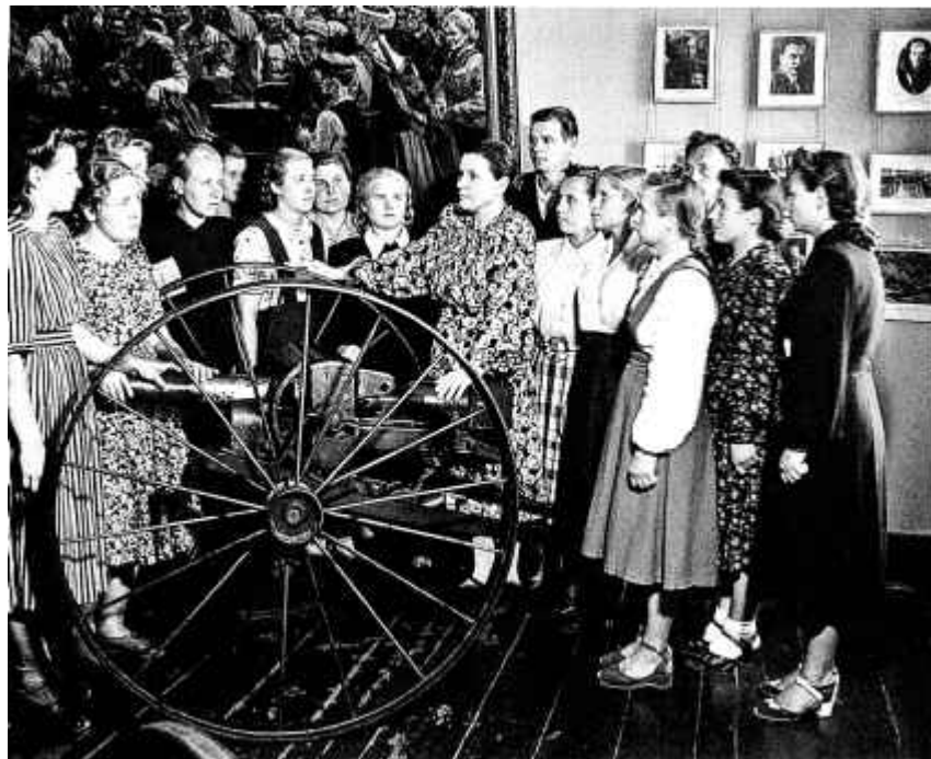
7. У адной з залаў Белдзяржмузея гісторыі Вялікай Айчыннай вайны. 1954 г.