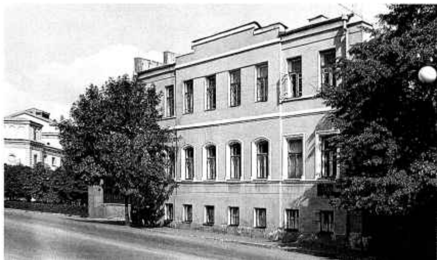
Ю. Будынак Музея Я. Купалы. 1959 г.