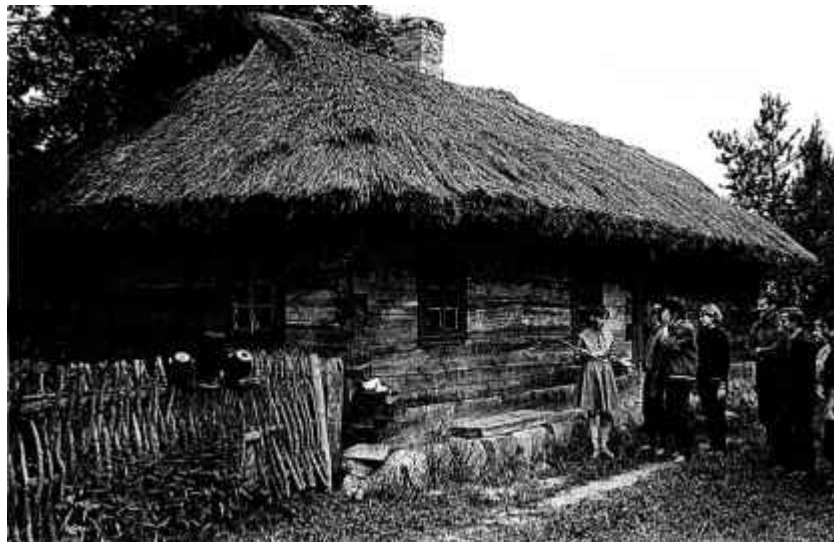
49. У Гудзевіцкім літаратурна-краязнаўчым музеі. 1986 г.