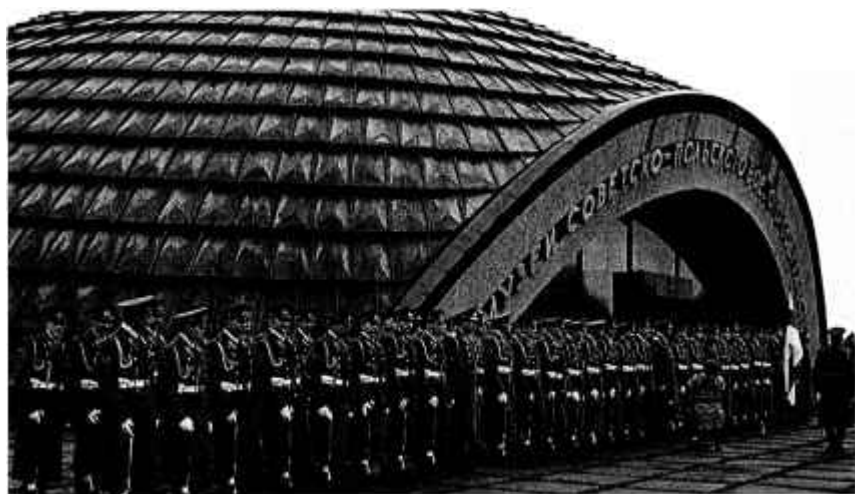
36. Будынак Музея савецка-польскай баявой садружнасці ў в. Леніна. 1981 г.