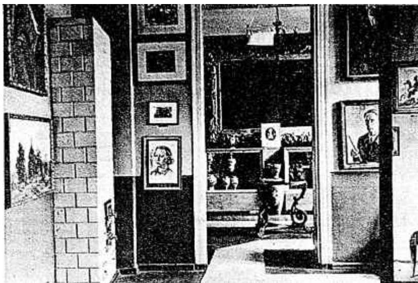
2. Фрагмент экспазіцыі Баранавіцкага музея. 1943 г.