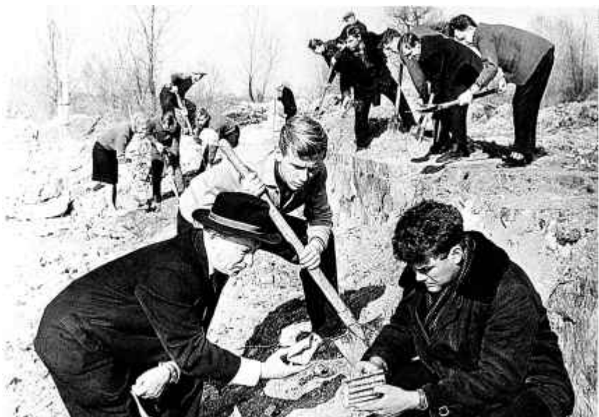
34. Раскопкі на тэрыторыі Брэсцкай крэпасці. 1966 г.