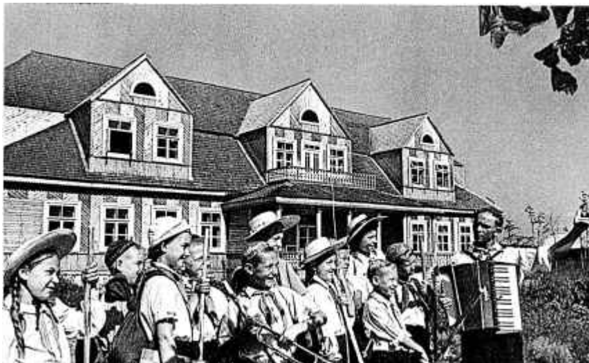
45. Школьнікі на экскурсіі ў Музеі прыроды Белавежскай пушчы. 1951 г.