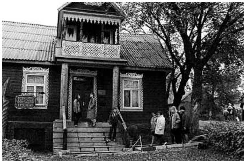
28. Будынак Браслаўскага раённага краязнаўчага музея. 1989 г.