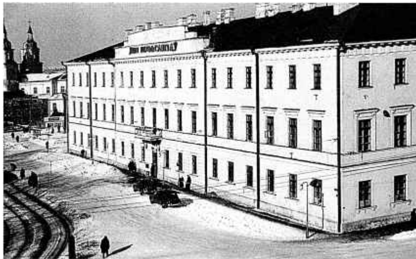
5. Будынак, дзе знаходзіўся Белдзяржмузей гісторыі Вялікай Айчыннай вайны. 1956 г.