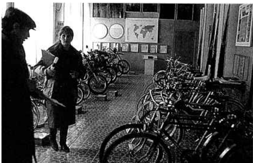
46. У музеі Мінскага мотавелазавода. 1991 г.