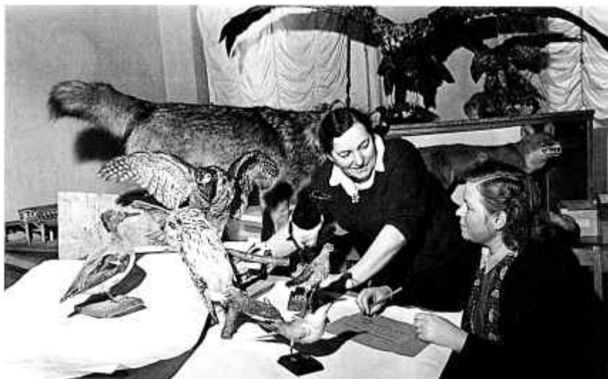
25. Супрацоўнікі Баранавіцкага раённага краязнаўчага музея апрацоўваюць прыродазнаўчую калекцыю. 1959 г.