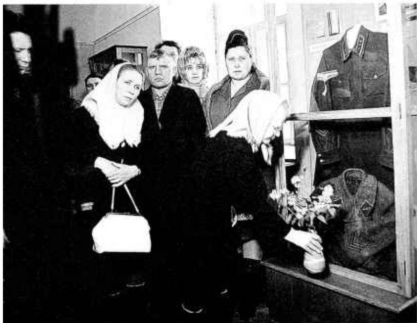
35. Удава аднаго з абаронцаў Брэсцкай крэпасці ля музейнай вітрыны, прывесчанай яе мужу. 1969 г.