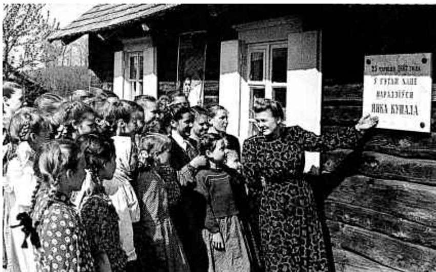
15. Школьнікі на экскурсіі ў Вязынцы. 1953 г.