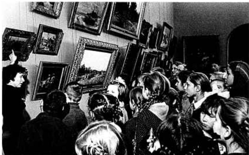
9. Школьнікі на экскурсіі ў Дзяржаўным мастацкім музеі БССР. 1959 г.