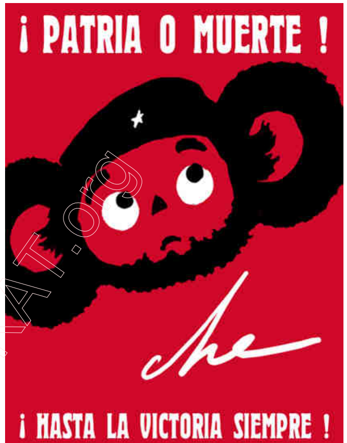
"Радзіма альбо смерць!" Чэбурашка. Сучасная расійская карыкатура на Чэ Гевару.

У 1960-я гады кубінскія рэвалюцыянеры Чэ Гевара і Фідэль Кастра карысталіся вялікай папулярнасцю не толькі ў Савецкім Саюзе, але сярод лявацкай моладзі ва ўсім свеце. Але прайшоў час, і камандантэ Фідэль ператварыўся ў карыкатуру на самога сябе. Стары, схуднелы пасля перанесенай аперацыі на кішках, з паўвар'яцкім позіркам з-пад сівых броваў – у