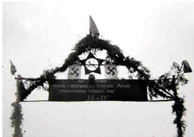
Вёска Івахнавічы на поўнач ад Брэста. Прывітальная брама з нацысцкімі і савецкімі сімваламі. Верасень 1939 г.