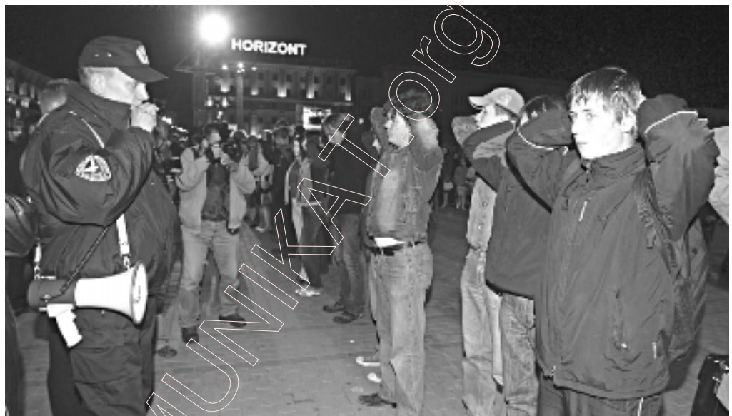
Супрацоўнікі міліцыі выціскаюць з Кастрычніцкай плошчы удзельнікаў акцыі салідарнасці. Мінск, 16 верасня 2006 году.

Лідэр апазіцыі Мілінкевіч паспеў выкарыстаць сцэну і заклікаў ісці на Кастрычніцкую плошчу, каб выказаць такім чынам салідарнасць не толькі сем’ям зніклых, але й запатрабаваць вызвалення лідэра Маладога фронту Змітра Дашкевіча. Ён быў арыштаваны пасля сустрэчы ў Магілёве з маладафронтаў-