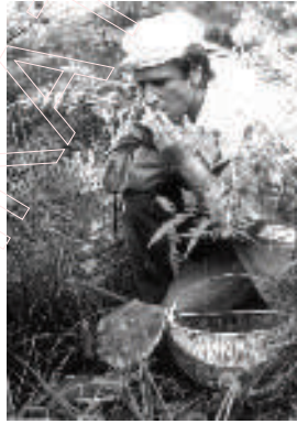
У грыбах. 1986 год.