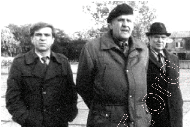
З Янкам Брылём і Максімам Танкам у Брэсцкай крэпасці. 1987 год.