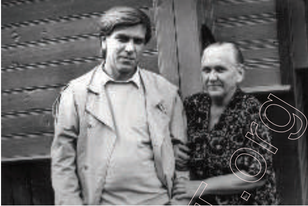
З мамай каля роднай хаты. Вёска Глыбачка. 1989 год.