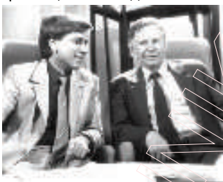
З Васілём Быкавым на Беларускім тэлебачанні. 1987 год.