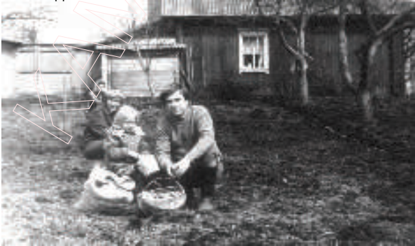
Бульба на бацькоўскім пляцы выкапана. 1984 год.