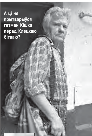
А ці не прытварыўся гетман Кішка перад Клецкаю бітваю?