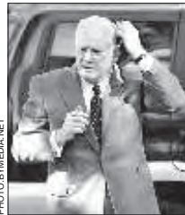
Асыярожны Алягірдас Бразаўскас — непатапалыны лідэр літоўскай палітыкі.