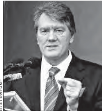
Юшчанка — гэта альтэрнатыва ня толькі Януковічу, але й Пуціну, й Лукашэнку, стылю іхнага кіраванья. Нават зьявячаны атрутаю, ён іх палюхае.

Больш пра падзеі ва Украіне на сайце www2.pravda.com.ua .