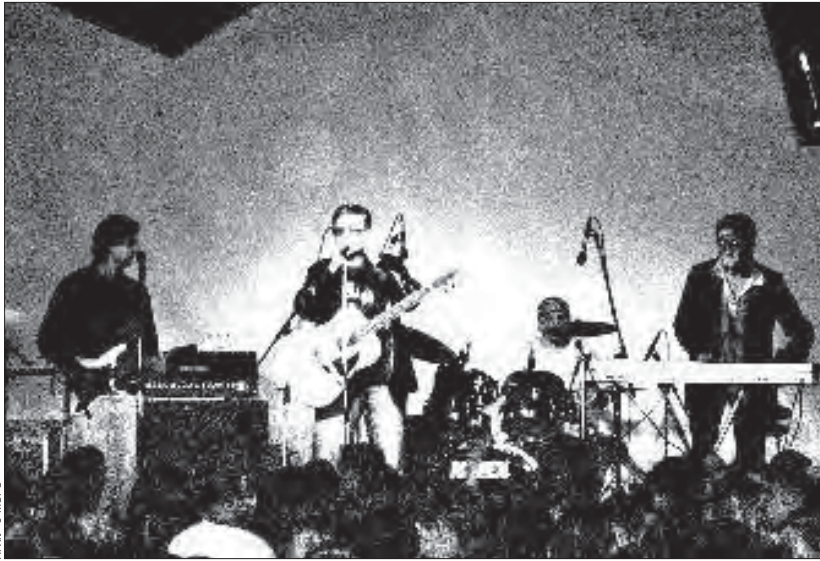
У клубе «Экстрым» граюць «J-Морс».

можна было пачуць «Індыга» зь нечаканай акустычнай праграмай. Як выявілася, у групы нават няма акустычнай гітары — пазычылі ў Віктара Маўчанава. Аднак у такім камэрным выкананьні музыка Русі набывае дадатковы прысьмак. «Індыга» зайграла колькі песень са сваёй пакуль адзінага альбому «Дні» і некалькі нечаканых кавэрэў, як «Come Together».