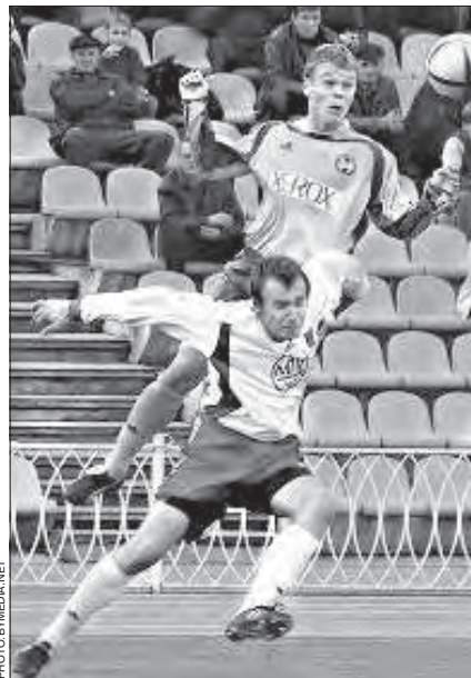
Гульня чэмпіянату Беларусі паміж БАТЭ (Барысаў) і «Славіяй» (Мазыр) 25 кастрычніка ў Барысаве. Гаспадары поля заробілі ў сваю скарбонку яшчэ 3 очки.