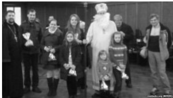
25-га снежня: сьв. Мікалай зь дзецьмі

Пасьля набажэнства ў прыцаркоўнай тэатральнай залі сьвяты Мікалай раздаў прысутным дзецям падарункі і перадаў іх праз сваякоў тым дзецям, што па розных прычынах не прысутнічалі на сьвяце.