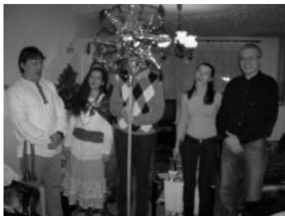
КАЛЯДОЎШЧЫКІ ў Празе