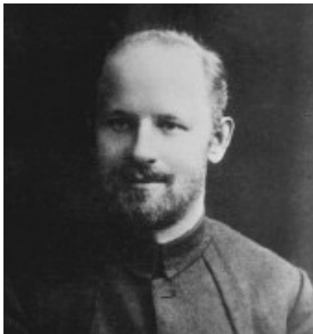
Вацлаў Ластоўскі - самы знакаміты сын Глыбоччыны