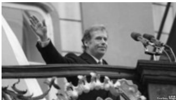
Сьв. памяці Вацлаў Гавэл