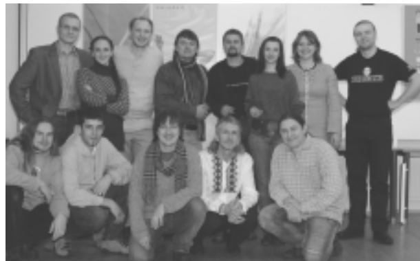
Гурт СТАРЫ ОЛЬСА і арганізатары канцэрту

Гэтая культурніцкая акцыя была зладжаная суполкай “Пагоня”, што задзіночвае беларусаў Чэхіі, пры мэдыяльнай падтрымцы часопісу “Belarusian Review” і “Крывіі” – газэты беларускай грамады ў Чэскай рэспубліцы.