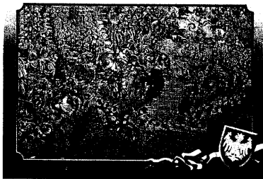
Польская паштоўка з выявай карціны «Бітва пад Оршай»