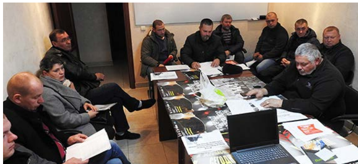
Собрание работников УСП «Трест «Реммонтажстрой», состоящих в Независимом профсоюзе.