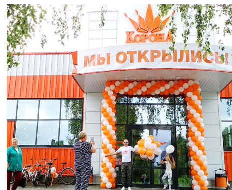
И в Копыси.

— Нужна конкуренция, чтобы мы видели реальную картину. И вот тогда я попросил, чтобы ты спланировал