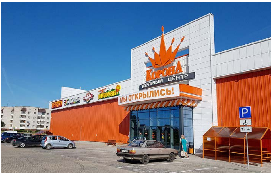
«Корона» в Шклове.

Во-первых, стоит напомнить, что именно глава государства своим указом № 297 «О проведении эксперимента» позволил создавать магазины в Оршанском районе, несмотря на имеющийся антимонопольный барьер в 20%. Это ограничение появилось не на пустом месте: несколько лет назад экспансия «Евроопта» и «Добронома» вызвала беспокойство владельцев неболь- Один из трех магазинов «Евроопт» в Копыси