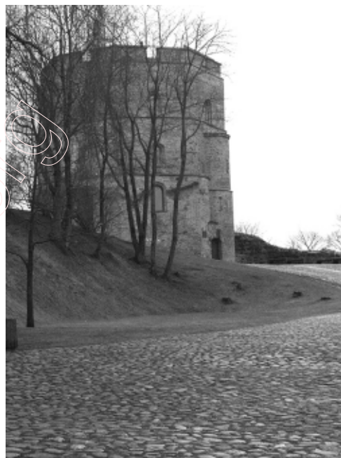
Помнік на магіле паўстанцаў, які Ян Булгак сфатаграфавалі ў 1930 годзе, і сённяшні выгляд гэтага месца. Вільня, 30 студзеня 2008 году.

генцы або самадзейных суполак тут выніку не дадуць. Ініцыяваць устаноўку мемарыяльнага знаку на магіле Кастуся Каліноўскага можа і павінна беларуская дзяржава. Апроч усяго іншага, такія захады сталі б пазітыўнай справай у беларуска-літоўскіх міждзяржаўных дачыненнях.