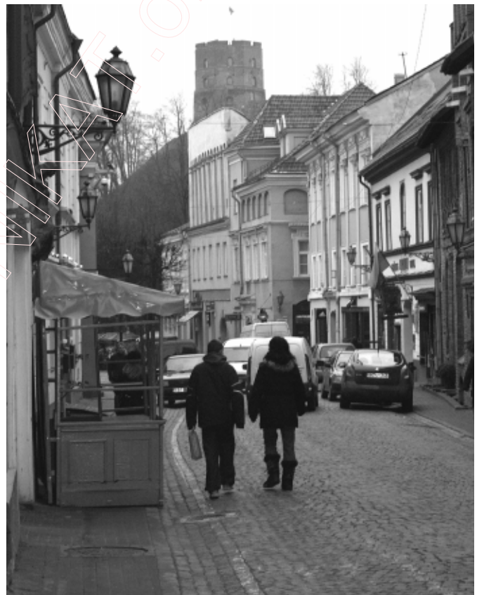
Славутая гара, славутая магіла... Вільня, 30 студзеня 2008 году.