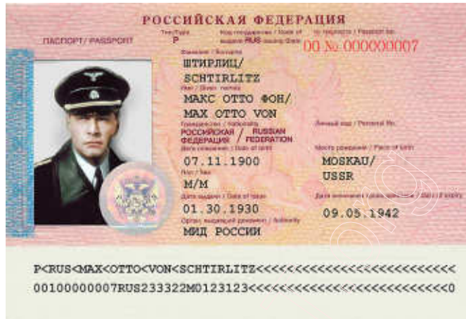
Першы біяметрычны пашпарт

Якое дзіўнае супадзенне! Нейкі час таму ўлада ўступавалася тым, каб узяць пад свой кантроль інтэрнэт. І не-