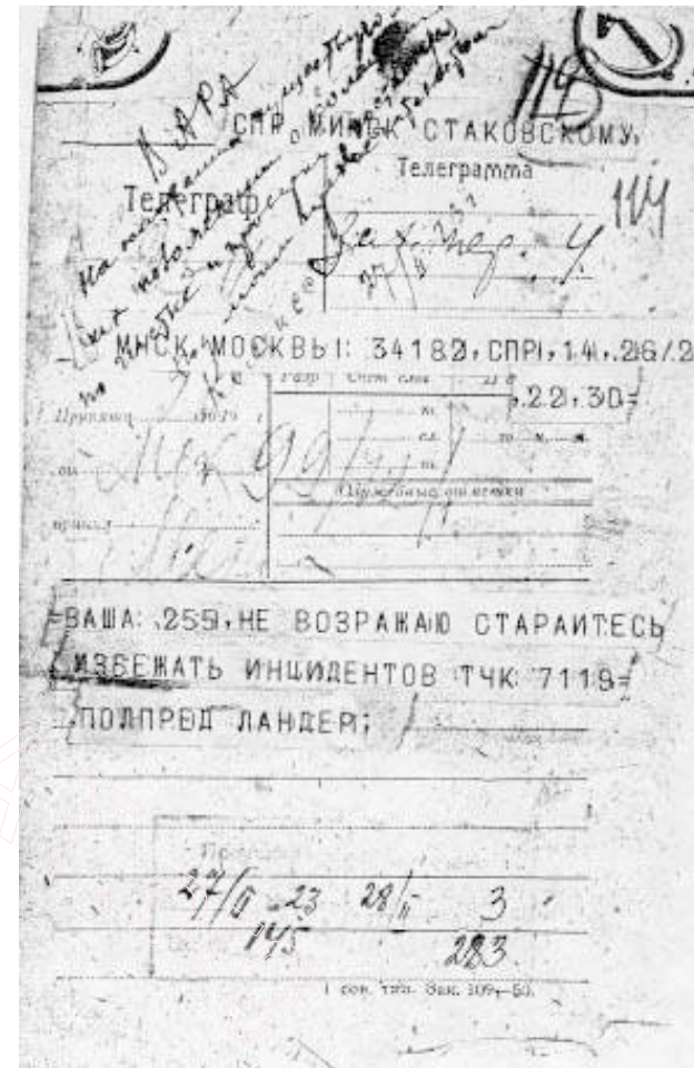
На менскім тэлеграфі зьявіліся новыя блянкі — зь сярпом і молатам