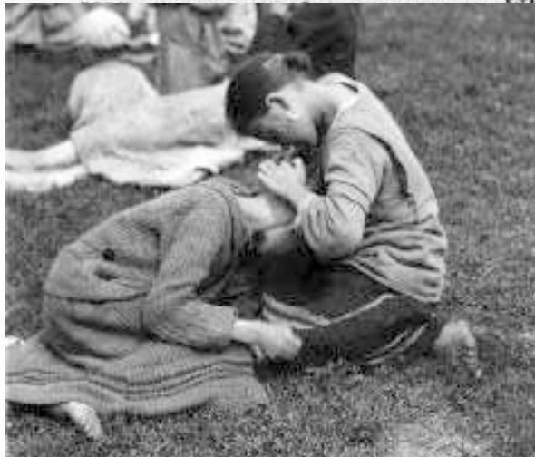
На бирже труда.

Ком'ачейка Наркомпроса с членов союза Раборос, по на газеты через ком'ачейку шипееи только на местные аг их по почте на дом, все же на местные и центральные ком'ачейки должны и делово в „Доме просвещения (тичоская 19), (быв. „Аквар