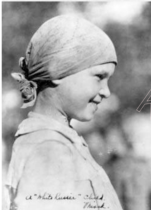
«White Russia» Child. Thick.

Последнее место, в порядке указанном мною, занимает АРА. Это