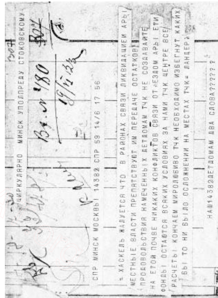
У Менск тэлеграма Ландэра прыйшла за тры дні да ад'езду амэрыканцаў. Але была зарэгістравана ў апарате Стакоўскага толькі праз два дні пасля закрыцьця акругі АРА

Мука пшанічная – 348 мяхоў, груца кукурузная – 75 мяхоў, цукар – 107 мяхоў, гарбата – 11 пудоў 35 фунтаў, малако – 10 260 бляшанак, какава – 176 пудоў, мыла – дзьве скрынкі, вагой 9 пудоў 31 фунт.