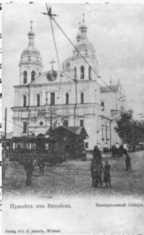
Приветъ изъ Витебска. Катедральный Соборъ.

двух... стених стения Влагод кладок Винозн к прода ти.