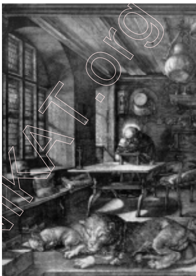
А. Дзюрэр. “Св. Еранім”. 1514 г.

гу, Страсбургу, Ліёне і многіх іншых гарадах. Толькі да сярэдзіны XVI ст. колькасць выданняў Бібліі з ілюстрацыямі, што ўзыходзілі да дзюрэраўскага “Апакаліпсіса”, дасягнула ліку, які на сённяшні дзень не можа быць вызначаны з абсалютнай дакладнасцю 10 .