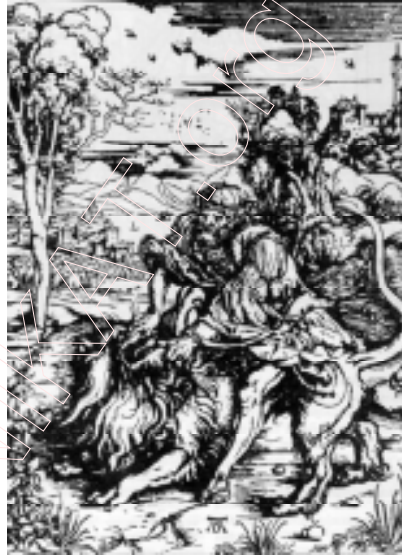
А. Дзюрэр. “Самсон і леў”. 1496–1497 гг.

гадзіннік, кнігі, падушкі на невысокіх лаўках. Аднак “Св. Еранім” Дзюрэра паказаны ў глыбіні келлі, а Скарына, наадварот, свядома вылучаны на пярэдні план. Гэты кампазіцыйны прыём узмацняе значнасць партрэтаванага, які тут не другасны, не падпарадкаваны інтэр’еру, але дамінуе ў ім. Тым самым рэнесансаваы характар твора ўзмацняецца.