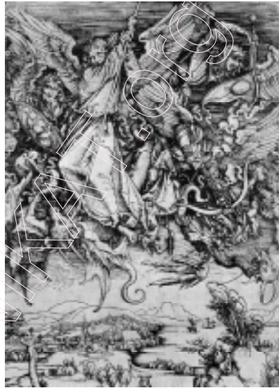
А. Дзюрэр. “Бітва архангела Міхаіла з д’яблам”. 1498 г.

ную; змяніў тыпаж архангела Міхаіла і анёлаў (у параўнанні з вобразамі Дзюрэра яны больш індывідуалізаваны). Адрозненне адчувальнае ў манеры гравіроўкі. Тонкія артыстычныя штрыхі дзюрэраўскай работы, што нагадваюць тэхніку гравюры на метале, у творы майстра Скарыны ўступілі месца больш грубым і сакавітым штрыхам, якія як бы сцвярджаюць спецыфіку абразной ксілаграфіі. Акрамя таго, у адлюстраванні дракона мастак Скарыны ўпершыню выкарыстаў чысты чорны колер, што выступае як сродак характарыстыкі адмоўнага пачатку. Рэзкія кантрасты чорнага і белага (белым называюцца свядома акцэнтаваныя блікамі святла фігуры архангела Міхаіла і анёлаў) узмацняюць напружанне і драматызм барацьбы. Дзюрэр у сваёй рабоце такія кантрасты не выкарыстоўваў. Скінуўшы дракона на зямлю (у Дзюрэра ён узняўся ў неба) і паказаўшы яго чорным, ён