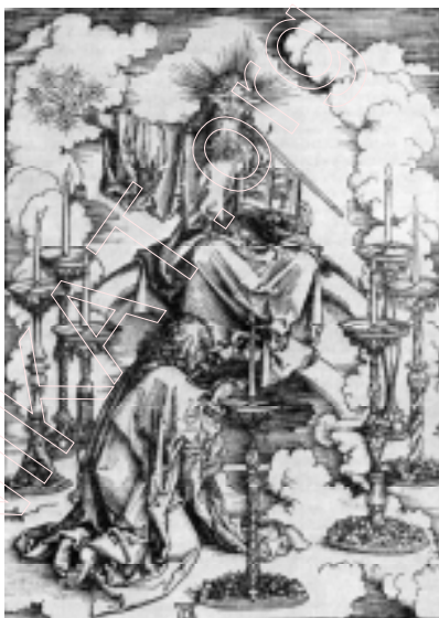
А. Дзюрэр. “Сем свяцільняў”. 1498 г.

Да аркуша Дзюрэра “Сем свяцільняў” з той жа серыі “Апакаліпсіс” узыходзіць і гравюра “Блаславенне” (Прамудрасць Божая. Прага, 1519): бачанні Іаана на востраве Патмос, калі ён паўстаў перад тронам Хрыста з кнігай у левай руцэ. Крыніцай для самога Дзюрэра паслужыла ілюстрацыя з Кельнскай бібліі (1479) Г. Квентэля, але Скарына, бясспрэчна, ідзе ад Дзюрэра. У яго — тыя ж кампазіцыя, і поза ўкленчанага юнака, і малюнак аблокаў вакол Хрыста. Аднак, як і ў “Тройцы”, адрозненняў больш, чым падабенстваў. Кампазіцыя Скарынавага “Блаславення” пададзена ў люстэркавай выяве; твар Хрыста павернуты да гледача, а ногі яго схаваны пад доўгай тогай; няма свяцільняў; у небе па абодва бакі ад Хрыста з’явіліся