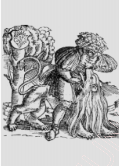
Біблія Ф. Скарыны. “Самсон і леў” з кнігі Суддзі. 1519 г.

Нельга таксама не адзначыць пэўнага падабенства з дзюрэраўскай работай “Св. Еранім” (1514) славутага “Партрэта Скарыны” — несумненна, самага рэнесансавага твора, пра які А. Сідараў пісаў: “З пачуццём уласнай годнасці, якое ўпершыню ўзнікла ў славянскім свеце, Скарына змяшчае — і не раз! — у сваіх выданнях не выяву легендарных святых, а ўласны партрэт” 7 . Партрэт Скарыны і “Св. Еранім” Дзюрэра аднолькава адносяцца да тыпу “партрэтаў у інтэр’еры”. Падобныя і асобныя дэталі: пясочны