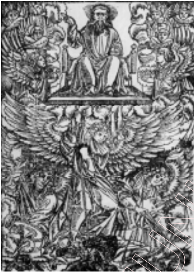
Біблія Ф. Скарыны. “Тройца” з кнігі Быццё. 1519 г.

Скарыны і Дзюрэра супадаюць агульная кампазіцыя, поза фігуры крылатага архангела Міхаіла (у Скарыны яна, праўда, дадзена ў люстраным адбітку), палажэнне яго рук, узнятых з кап'ём над галавой, рысунак вялікіх, шырока раскінутых крылаў. Разам з тым гравюры маюць і істотныя адрозненні. У Дзюрэра сцена барацьбы з д'яблам паказана на фоне неба, а ў Бібліі Скарыны — на зямлі. Скарынаўскі мастак зняў гарысты пейзаж і правага верхняга анёла з мячом, зрабіўшы з чатырохфігурнай кампазіцыі трохфігур-