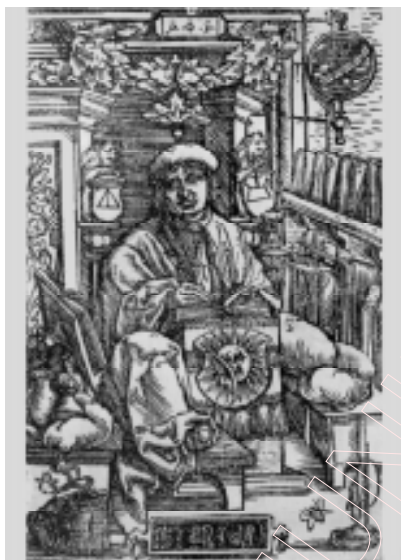
Біблія Ф. Скарыны. Партрэт Ф. Скарыны з кнігі Ісус Сірахаў. 1517 г.

Ханса Гольбейна-Малодшага. У тым жа годзе ў Аўгсбургу выйшла Біблія з гравюрамі Ганса Шэйфелайна і Ганса Буркмайра; у 1526 г. — у Нюрнбергу з гравюрамі Зебалда Бехама і г. д. Ілюстратары гэтых выданняў з большай ці меншай свабодай узнаўляюць надрукаваныя ў Вераснёўскай бібліі Лютэра копіі гравюр дзюрэраўскага “Апакаліпсіса” або гравюры Гольбейна. Пазней копіі “Апакаліпсіса” Дзюрэра (або ілюстрацыі вітэнбергскага і базельскага выданняў Біблій) з’яўляюцца ў Парыжы, Амстэрдаме, Аўгсбур-