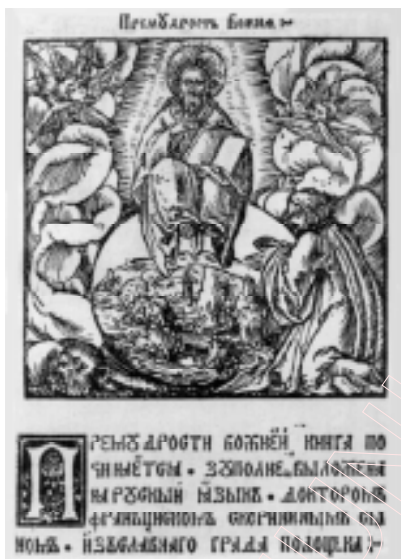
Біблія Ф. Скарыны. “Блаславенне” з кнігі Прамудрасць Божая. 1518 г.

гравюры, у якой верхняя і ніжняя часткі арганічна звязаны паміж сабой (сувязь ажыццяўляецца з дапамогай высока ўзнятых крылаў архангела Міхаіла, якія аб'ядноўваюць “тройцу” і “бітву” у непарыўнае цэлае). Да таго ж — і гэта таксама немалаважна — у верхняй частцы гравюры Тройца, насуперак візантыйскаму і старажытнарускіму мастацтву, адлюстравана з трыма лікамі. Гэта — новае слова ў беларускай (і ў цэлым усходнеславянскай) іканаграфічнай традыцыі 6 .