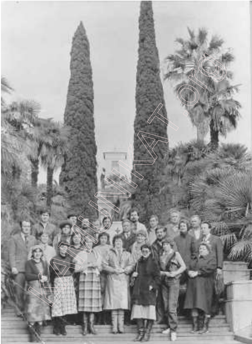
Сочы, 02. 01. 1985 г. Польская экскурсія, на якой аўтар быў гідам. Аўтар стаіць справа.