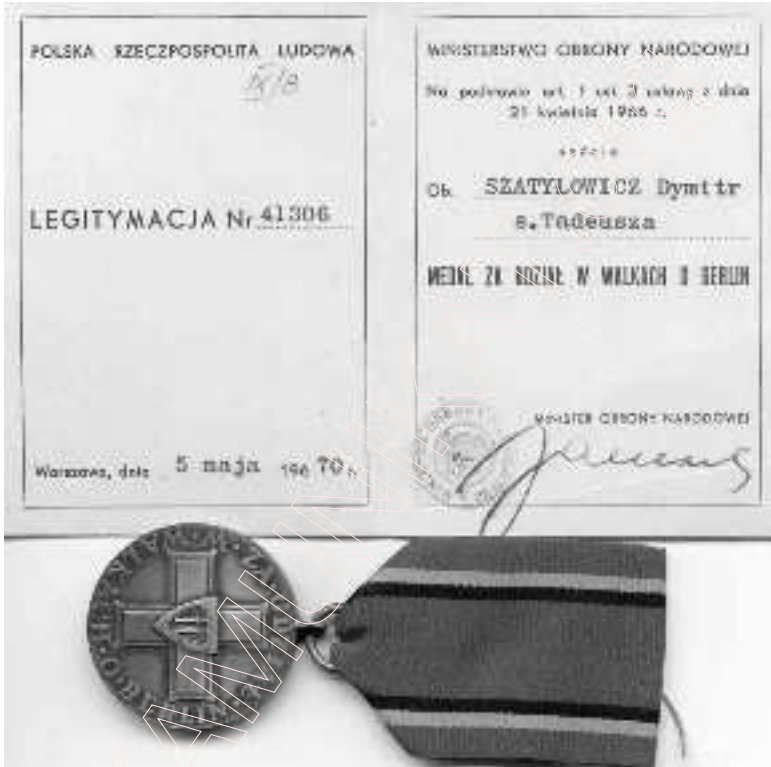
Медаль за ўдзел у баях за Берлін.