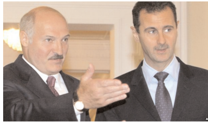
Аляксандр Лукашэнка і Башар Асад у Менску 26 ліпеня 2010.

26 траўня ў сырыйскім горадзе Хула пасля нападу ўрадавых войскаў знойдзены целы забітых прынамсі 90 чалавек, у тым ліку 32 дзяцей. У адказ на гэта Францыя, Нямеччына, Вялікабрытанія і іншыя краіны выслалі сырыйскіх паслоў. Амбасадар Сырыі ў Беларусі працягвае сваю працу.