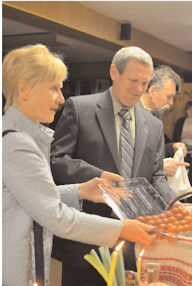
У царкве на Вялікдзень

Ала – гэта такая глыбокая абазнанасць у сучасных беларускіх праблемах, што ёй мог бы пазаздросьціць не адзін жыхар менскага