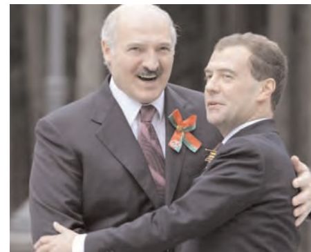
Аляксандар Лукашэнка і Дзьмітрый Мядзьведзеў

Аляксандра Лукашэнку павіншавалі таксама лідэры Вэнэсуэлы, Кубы, Ірану, Сырыі, В'етнаму, Кітаю а таксама кіраўнікі былых савецкіх рэспублік — Азэрбайджану, Арменіі, Грузіі, Казахстану, Узбэкістану, Украіны.