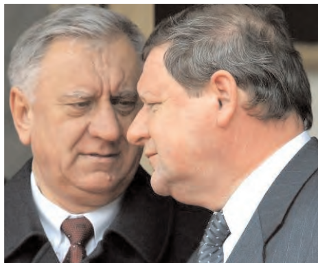
Міхаіл Мясьніковіч(злева) і Сяргей Сідорскі.

Аляксандар Лукашэнка напрыканцы сьнежня прызначыў Міхаіла Мясьніковіча прэм'ер-міністрам Беларусі замест Сяргея Сідорскага, які пасья так званых прэзідэнцкіх выбараў склаў свае паўнамоцтвы ў адпаведнасьці з Канстытуцыяй РБ. Міхаіл Мясьніковіч нарадзіўся ў 1950 годзе ў вёсцы Новы Сноў Нясвіжскага раёну Менскай вобласці. У 1972 годзе скончыў Берасьцейскі інжынерна-будаўнічы