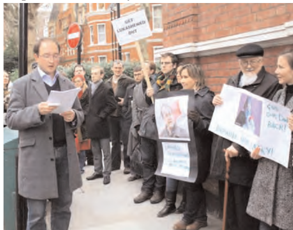
Акцыя пратэсту ў Лёндане

Пад такім лэзунгам 16 студзеня прайшла Акцыя салідарнасьці ў Беларусі і па ўсім сьвеце. Дэмакратычныя актывісты патрабавалі ад Лукашэнкі неадкладнага вызваленьня арыштаваных удзельнікаў мітыngu пратэсту 19 сьнежня ў Менску.