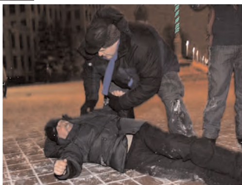
Зьбіты міліцыянтамі на Плошчы і пасля арыштаваны кандыдат ў прэзыдэнты Андрэй Саньнікаў

Каля 15-20 тысячаў чалавек (па іншых дадзеных да 40 тысяч) узялі ўдзел у акцыі пратэсту на