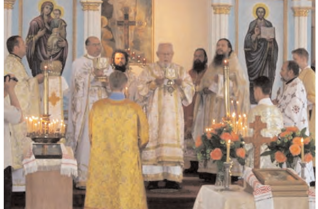
Прамаўляе Уладыка Аляксандр