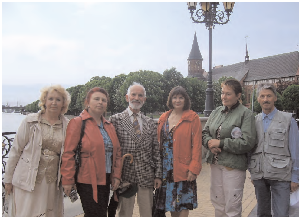
Віленчукі ў Калінінградзе