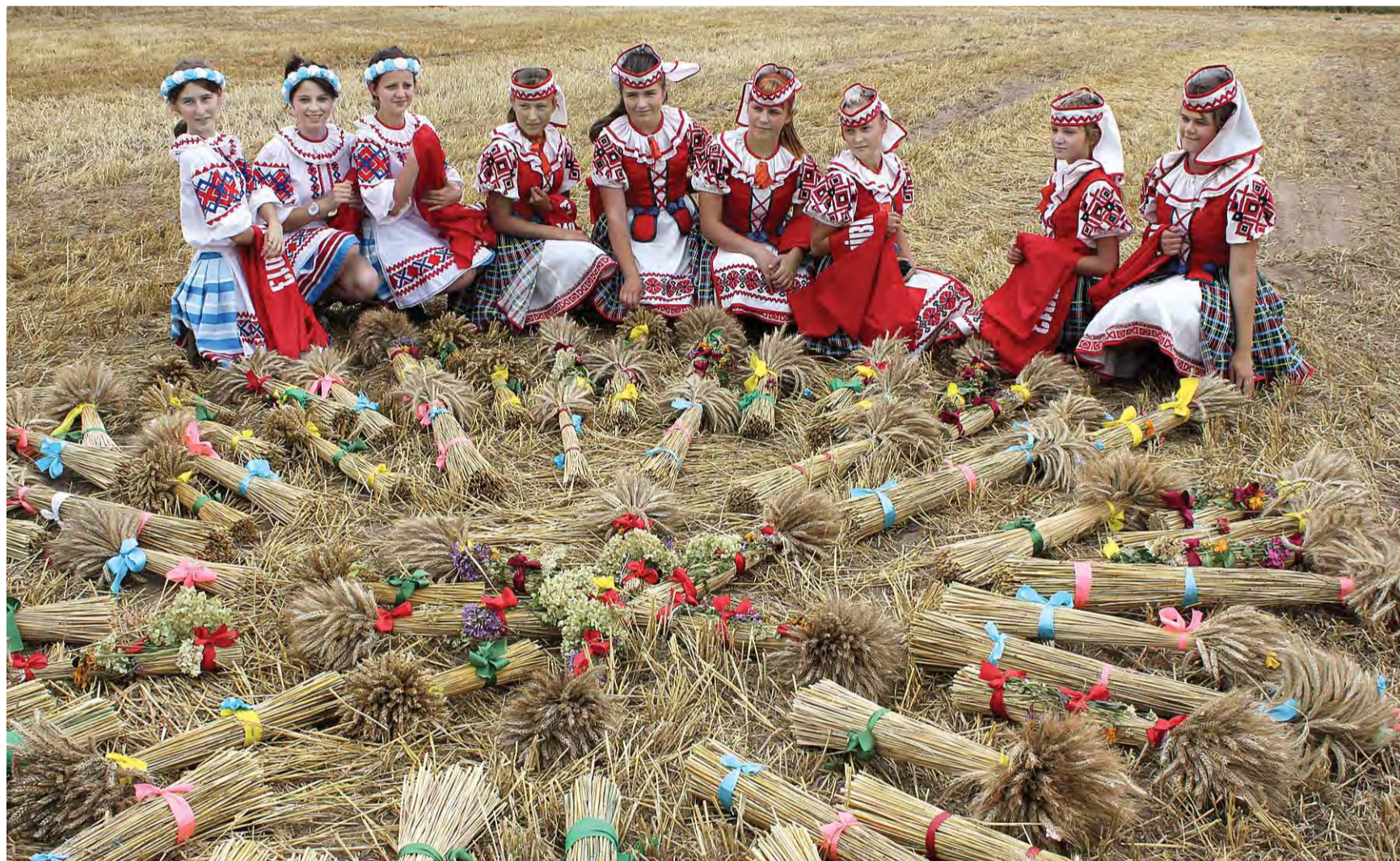
СТАРТ. В пятницу, 19 июля, в подсобном сельском хозяйстве ОАО «Слуцкий «Агросервис», возле деревни Строхово, состоялся районный праздник «Зажынкi-2013». Он традиционно прошёл со всеми атрибутами: серпами, снопами, караваями, народными костюмами, песнями самодеятельных коллективов. Первые лица района поздравили с началом жатвы главных героев праздника: комбайнёров и других тружеников села. текст: Алевс Доштанко