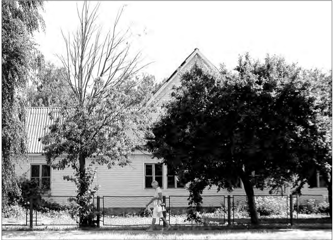
«НЯМЕЦКІЯ» ДАМЫ. У адным з іх доўгія гады размяшчалася Слуцкая станцыя юных тэхнікаў. Нядаўна яе перавялі ў будынак былой СШ №3. Лёс дома і ўчастка пакуль не вырашаны.

Дык вось, немцы і тут правялі свой «рацыяналізм». Яны скарысталі галодных, замораных габрэйў Слуцкага гета, якіх прымуслі пад аховай паліцаў