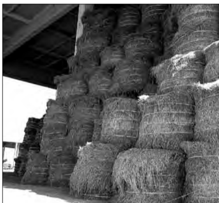
ЛИДЕР. Слуцкий льнозавод сегодня входит в тройку лучших производителей льноволокна.