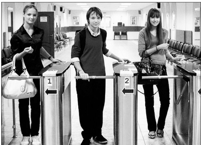
МЕРЫ БЕЗОПАСНОСТИ. Электронная система доступа в учебные учреждения создаётся в целях безопасности учащихся.