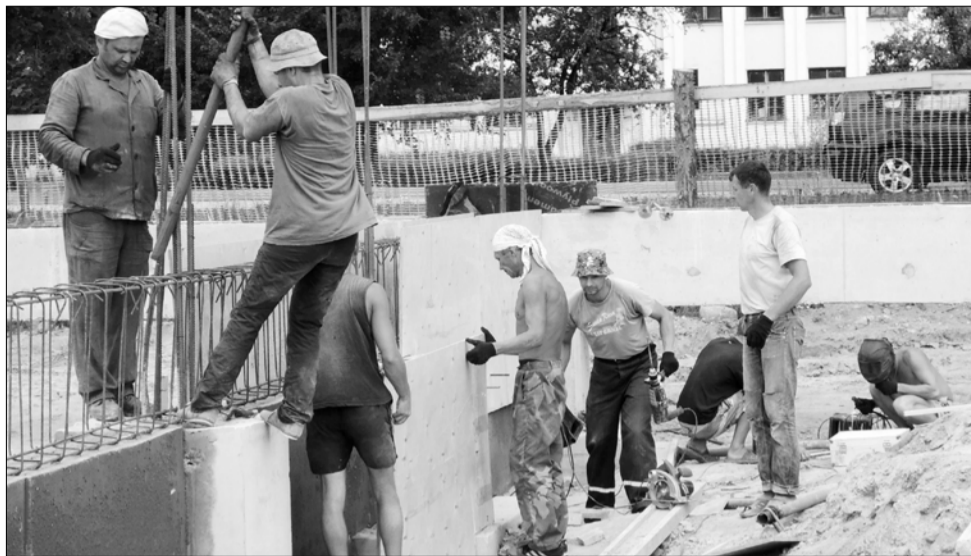
СУПЕРМАРКЕТ. Планируется, что новый торговый центр примет первых покупателей уже в ноябре.