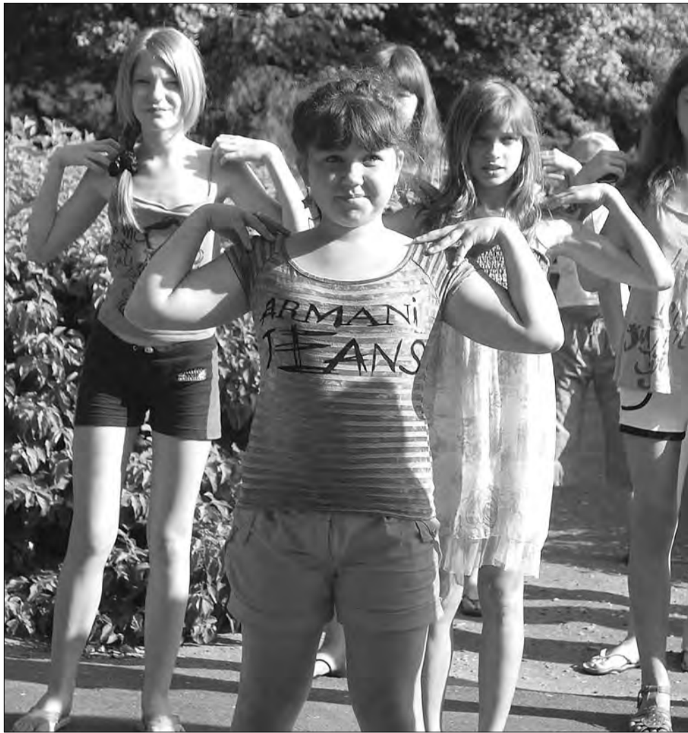
РОДНОЕ МЕСТО. «Зорька» за годы моего отдыха в ней стала для меня вторым домом.

Столовая — одно из моих любимых мест в «Зорьке»: люблю хорошо поесть. Кормили здесь вкусно (по