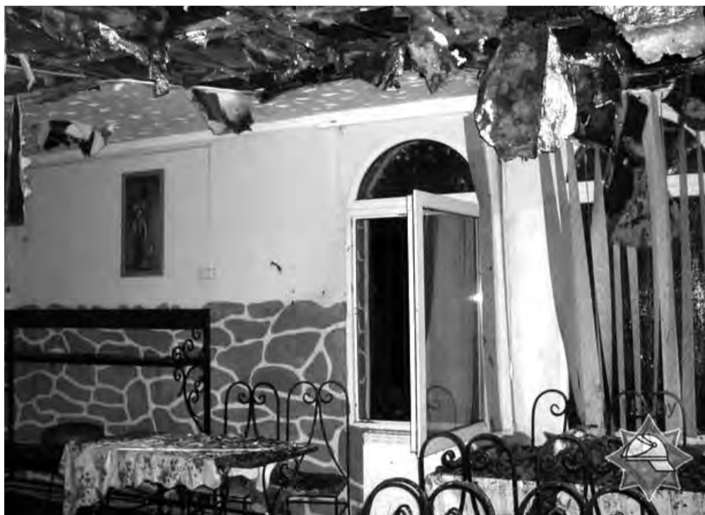
ПОЖАР. Основная версия пожара в придорожном кафе недалеко от деревни Весёя — поджог.

Первый автомобиль РОЧС преодолел перекрёсток без происшествий