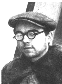
Баркоўскі С. А.

2 БАРКОЎСКИ Сцяпан Андрэевіч [28.3(10.4).1905, Слуцк — 11.6.1966, Мінск], крытык, літаратуразнавец, этнограф. Падлеткам браў удзел у Слуцкім паўстанні (1920). Скончыў педагагічны ф-т (1926) і аспірантуру (1931) БДУ. Працаваў у Інстытуце гісторыі АН БССР. Першыя публікацыі па этнаграфіі з’явіліся ў 1925. Як літаратурны крытык сфарміраваўся ў «Маладняку». У сярэдзіне 1920-х г. у ягонай кватэры ўтварыўся своеасаблівы «літаратурны салон» маладых літаратараў. Арыштаваны 14.11.1936. Асуджаны да 10 гадоў ППК. У 1936—46 знаходзіўся ў канцлагерах Краснаярскага краю і Сярэдняй Азіі. З канца 1946 жыве ў Фрунзе (Кыргыстан). У 1950 накіраваны ў Казахстан на асваенне цаліны. Рабілітаваны ў 1955. Вярнуўся ў Беларусь. З 1956 працаваў у Інстытуце мастацтвазнаўства, этнаграфіі і фальклору АН БССР. Займаўся этнаграфіяй Беларусі XIX ст. Укладальнік кніг твораў А.Дудара (1959), В.Каваля (1959), М.Нікановіча (1960). У 1959 дзякуючы яго намаганням выйшаў з друку зборнік В.Маракова «Лірыка» (хоць і ў знявечаным выглядзе — дзякуючы ўжо намаганням іншых). Пахаваны ў Мінску на Усходніх могілках.