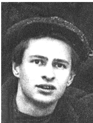
Фамін С. У. 1928 Г.

16 ФАМІН Сяргей Уладзіміравіч [29.4(12.5).1906, в. Пепелеўка Мсціслаўскага пав. Магілёўскай губ., цяпер Манастыршчынскі р-н Смаленскай вобл., Расія — 4.12.1941, Ярэга, Комі АССР], паэт. З сям'і вясковага настаўніка. Скончыў Мсціслаўскую сямігодку. Яшчэ школьнікам даслаў карэспандэнцыі ў мясцовыя газеты. У 1925 скончыў Магілёўскі педтэхнікум. Два гады настаўнічаў на Барысаўшчыне, потым паступіў на літаратурна-лінгвістычнае аддзяленне педагагічнага ф-та БДУ, якое скончыў у 1930.