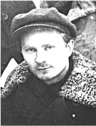
Галавач П. Р.

1928 першы сакратар ЦК АКСМБ. У 1929—30 нам. наркама асветы БССР. У 1922—23 вучыўся ў Мінскай партшколе, у 1926 скончыў Камуністычны ун-т Беларусі. Быў рэдактарам газ. «Чырвоная змена», час. «Маладняк», «Польмя». З’яўляўся адным з лідэраў літаратурных аб’яднанняў «Маладняк» і БелАПП. Ініцыятар арганізацыі крытыка-творчага аддзялення МВП. Друкавацца пачаў у 1921. Першае бел. апавяданне «Загубленае жыццё» апублікавана ў газ. «Савецкая Беларусь» у 1925. У 1927 выйшла першая кніга апавяданняў «Дробязі жыцця». Тэматыка шматлікіх аповесцей, апавяданняў, нарысаў звязана з грамадзянскай вайной і жыццём вёскі. Яго творы карысталіся поспехам, яны перакладаліся на польскую, украінскую, чэшскую, яўрэйскую мовы.