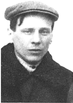
Броўка П. 1928 г.