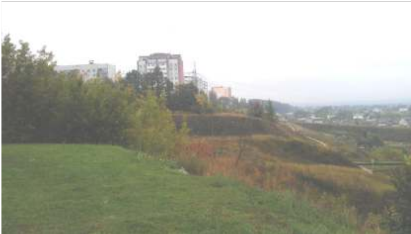
На фота месца дзе павінен паўстаць пешаходны і аўтамабільны мост праз чыгуначныя шляхі

Такі адказа атрымалі актывісты магілёўскай ініцыятывы “Імпульс”, якая займаецца вырашэннем праблем з добраўпарадкаваннем двароў і раёнаў горада.