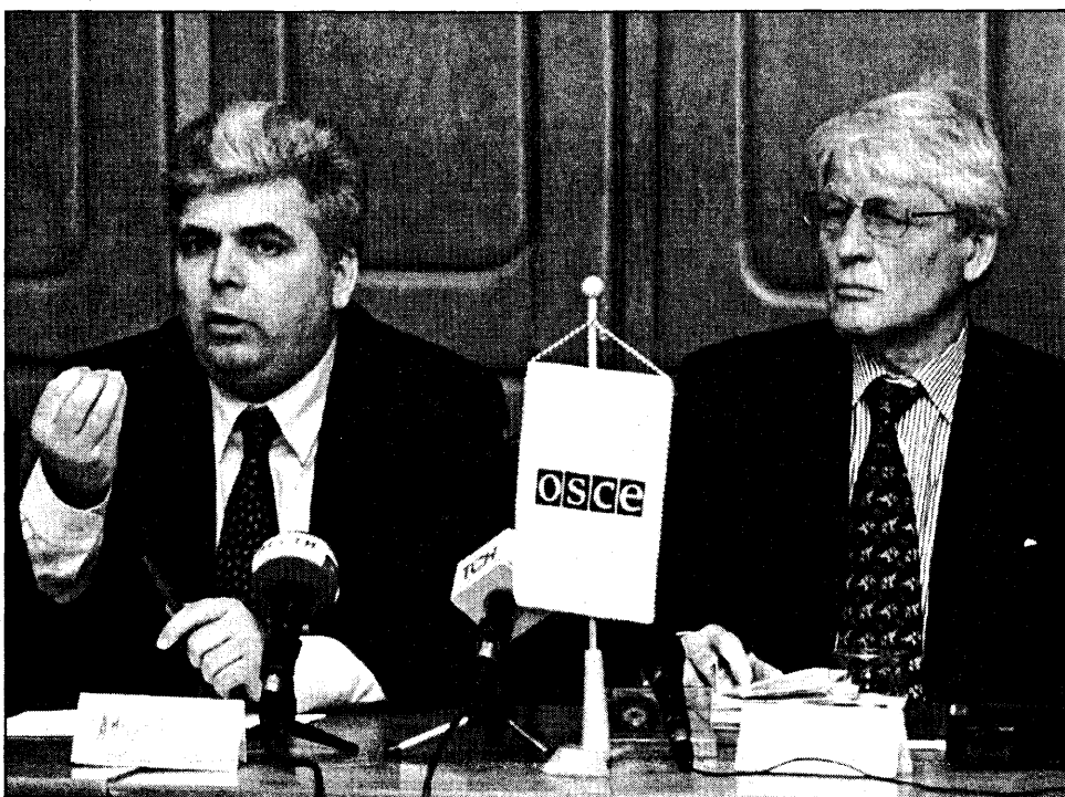
Ханс-Георг Век (справа), прэсідэнт Консультатывна-наблюдатэльнай Групы ОБСЕ ў Мінску