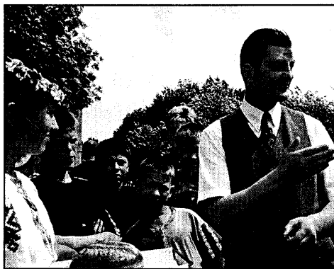
Встреча в интернате в Ошмянах

телей, которые лишены родительских прав. А лишаются права воспитывать своих чад около 5 тысяч жителей страны ежегодно. На содержание детей в интернатах лишены платят государство 2 минимальные зарплаты в месяц. Государство недоволено — мало! А взять-то не с кого! Как правило, это впавшие в нищету алкоголики, и число их растет. В 1998 году у родителей по решениям судов отобраны в 6,1 раза больше детей, чем в 1990-м.