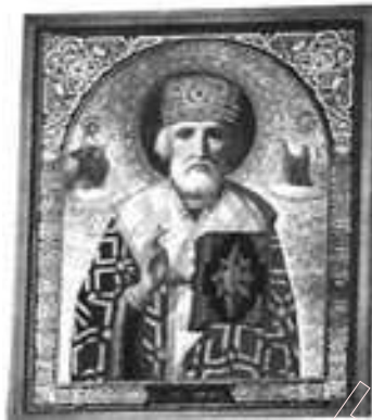
Ікона Св. Міколы

Апостальскім крыжам на тарчы і мечам ва ўзнятае ўгору руцэ з нябёсаў бароніць нас ад ворагу, знішчае цмокаў, насланых нячыстым, стаіць за веру і праўду і самую нашу Айчызну. Для некага жа ён застаўся ранейшым Ярылам-Пагоняю.