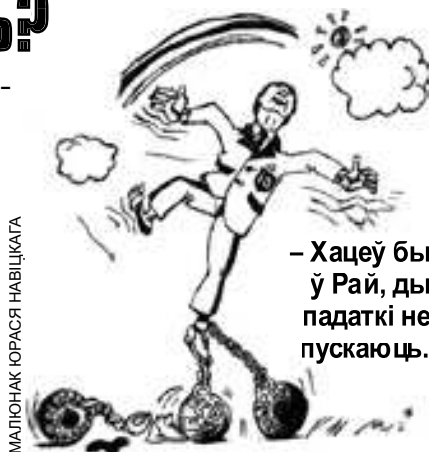
МАЛЮНАК ЮРАСА НАВІЦКАГА

Большасць працаўнікоў “Свелты” падтрымалі акцыю 15 снежня і патрабавалі ад сваіх лідэраў адказу на пытанне: “Што рабіць далей?” Спадзяванні дробных бізнесоўцаў, што іхні пратэст, выказаны двухтысячным маршам прадпрымальнікаў без падтрымкі грамадства, будзе пачуты ўладамі, не спраўдзіліся. Не спраўдзілася таксама інфармацыя напярэдадні рэспубліканскага страйку і шэсця аб тым, што ўлады разглядаюць прапанову Мінэканомікі аб захаванні для дробных прадпрымальні-