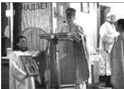
Дзень Св. Міколы ў серабранскай каталіцкай парафіі.

У гітарычным эсе “730 гадоў Пагоні” у сакавіцкім нумары “ВС” мы ўжо распавядалі нашым чытачам, як хрысціянізавалася імя нябёснага вершніка, абаронцы Беларусі. Запрасілі славяне (прабеларусаў гісторыкі яшчэ называюць заходнімі балтамі) да сябе варагаў, і славянскі назоў бога Сонца – Ярыла – трансфармаваўся ў скандынаўскае Юрга, адкуль да хрысціянскага Юрай заставаўся адзін крок. Цяпер Св. Юрай (Георгій)-Пераможца з