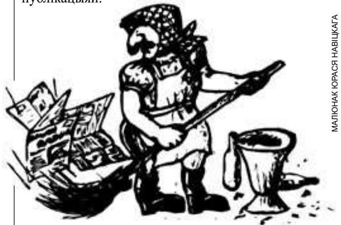
МАЛЮНАК ЮРАСА НАВІЦКАГА

Па словах “звышпільнай” вартаўніцы, выконваць паліцэйскія функцыі яе змусілі ейныя кіраўнікі. Апошнія, відаць, спадзяюцца адказнасць за парушэнне Закону ўскласці на кволяе жаночыя плечы. Зважаючы на тое, што гэта пакуль адзінкавы падобны ўчынак з боку вартаўніцы і, хутчэй за ўсё, ненаўмысны, рэдакцыя вырашыла на першы раз не даваць хаду справе, а абмежавацца толькі гэтай публікацыяй.