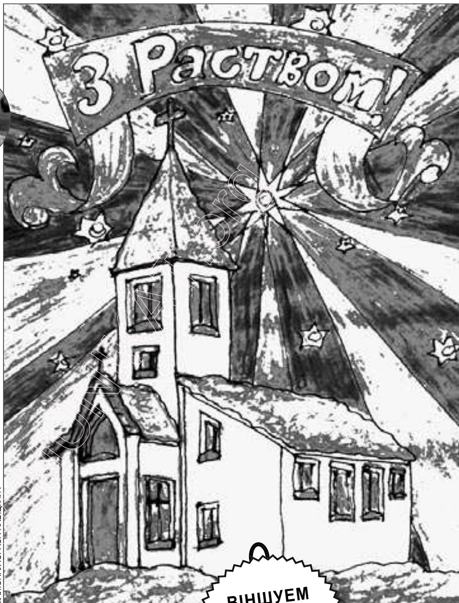
МАЛЮНАК ЮРАСА НАВІЦКАГА

мічны крызіс, 2009 год стаў для кожнага адметным у самым лепшым сэнсе гэтага слова.