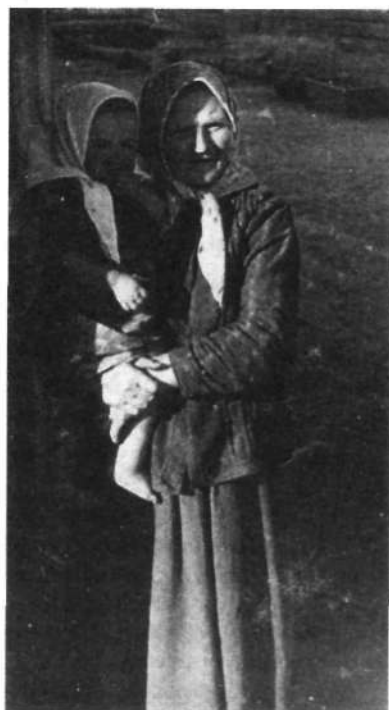
Ludność z okolic Pińska (początek lat 20.).