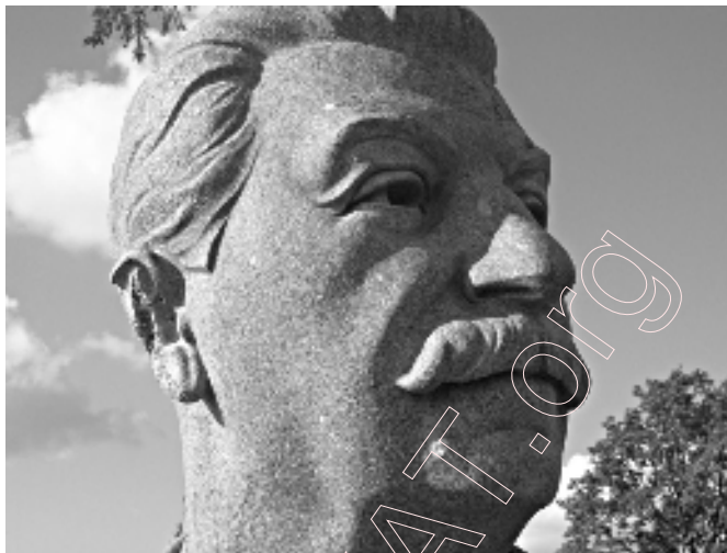
Вушы адарвала тросам... Бюст Сталіна ў вёсцы Арэхаўка, Мінскі раён, жнівень 2006 году.

Вось што піша пра “Лінію Сталіна” Віктар Суворав у сваёй кнізе “Ледакол”: “Увосені 1939 году, у момант пачатку другой сусветнай вайны, у момант усталявання