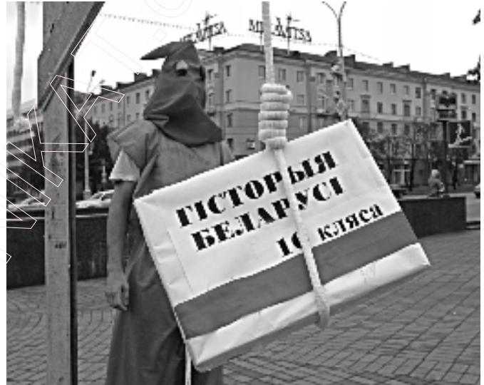
Падручнік гісторыі на шыбеніцы. Удзельнік тэатралізаванай акцыі пратэсту супраць выкладання гісторыі Беларусі па-руску праводзіць "экзекуцыю" над падручнікам. Мінск, плошча Якуба Коласа, 1 верасня 2006 г.

Дарэчы, зусім нядаўна на гэтай плошчы, якая ўвесь час пільна кантралюецца міліцыяй, быў апаганены помнік