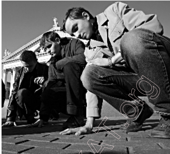
Флэш-моб на цэнтральнай плошчы. Маладыя людзі дакрануліся рукамі да месца, дзе стаяў наметавы лагер.

Самыя экстрэмальныя дзеянні нашай апазіцыі – гэта выхад на несанкцыянаваны мітынг з незарэгістраванай сімволікай. Зразумела,