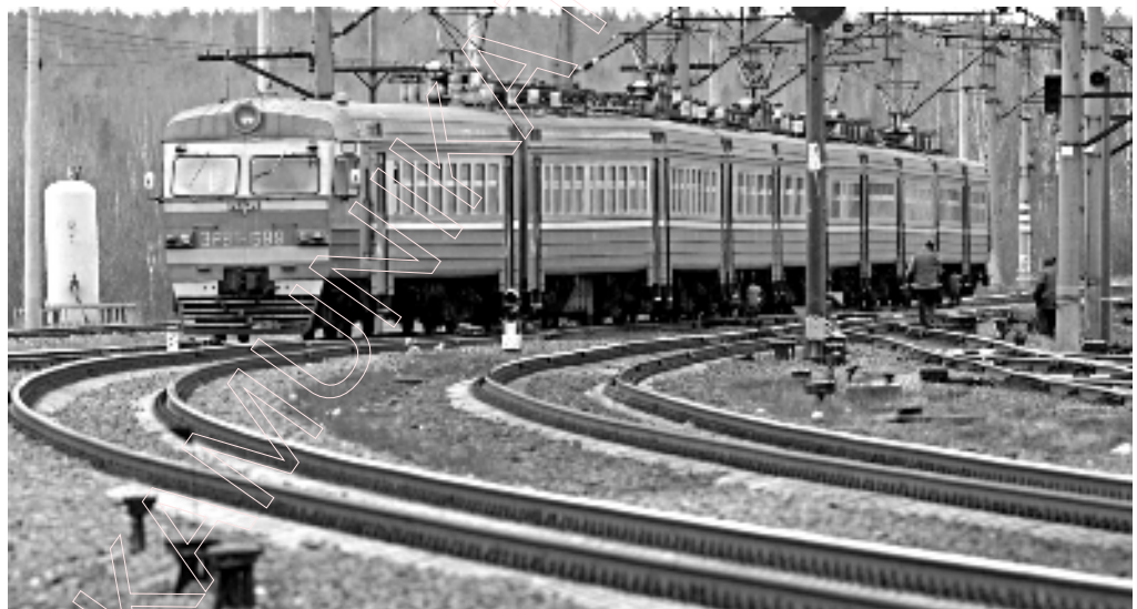
Электрацягнік Мінск – Пухавічы, у якім пасля свята горада адбылося масавае пабоішча.

Адна са сведкаў, мінская студэнтка Кацярына асноўнай прычынай бойкі лічыць п’янства на свяце горада 9 верасня і неадэкватныя паводзіны міліцыі, якая не спыніла масавага ўжывання ал-