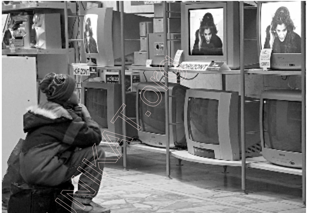
Падлетак глядзіць мексіканскі серыял у краме электронікі. Барысаў.

Канфлікт вакол Вікі Мароз, у якім, дзякуй Богу, Лукашэнка асабіста не ўдзельнічае, сведчыць пра тое, што ў Бе-