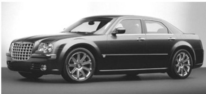
Крайслер 300С.

Генерал Дудаеў у канцы 1980-х служыў камандзірам авіяцыйнай дывізіі, якая базавалася ў эстонскім горадзе Тарту. Ён таксама займаў пасаду начальніка Тартускага гарнізона. Пазней Дудаеў стаў першым прэзідэнтам непрызнаванай чачэнскай рэспублікі Ічкерыя, а 21 красавіка 1996 году быў забіты ракетай, пушчанай з расійскага самалёта.