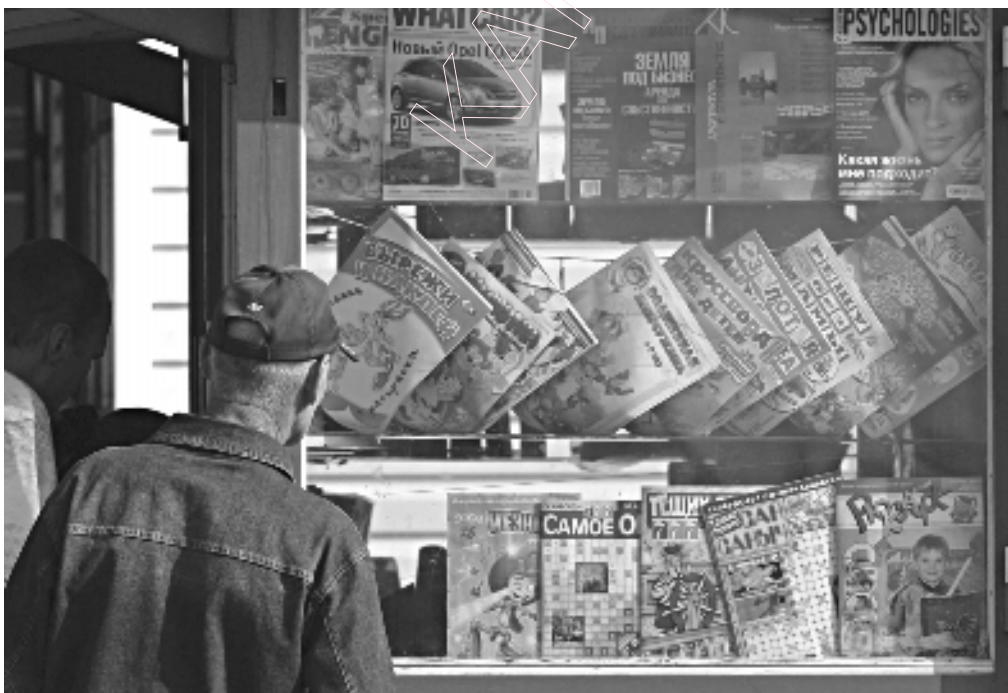
Каля кіёска «Саюздруку». Мінск, кастрычнік 2006 году.

10 кастрычніка 1939 году Савецкі Саюз перадае Вільню Літве. Перад гэтым меркавалася зрабіць горад сталіцай Заходняй Беларусі. Аднак сталася па-іншаму. Узамен за Вільню Літва дазволіла размясціць на сваёй тэрыторыі савецкія вайсковыя базы.