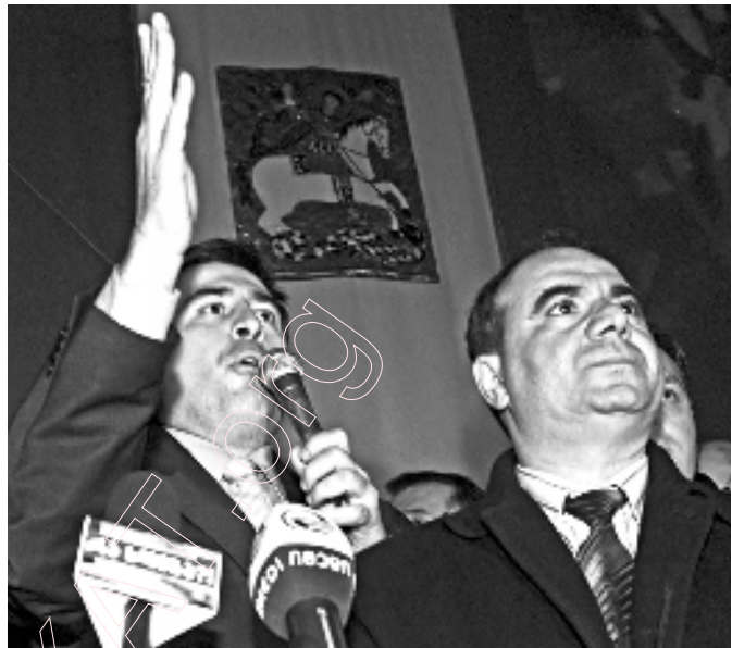
Лідэры «рэвалюцыі ружаў» Міхаіл Саакашвілі (злева) і Зураб Жванія. Тбілісі, 23 лістапада 2003 года. (Прэм'ер-міністр Грузіі Зураб Жванія трагічна загінуў у лютым 2005 года. — заўвага рэд.)

Лукашэнка, і крамлёўскае кіраўніцтва не аднойчы выказвалі сваё негатыўнае стаўленне да мірных дэмакратычных пераўтварэнняў у былых савецкіх рэспубліках – да "аранжавай рэвалюцыі" ва Украіне, "рэвалюцыі ружаў" у Грузіі і г.д. Антыгрузінская прапаганда ў Беларусі дасягнула свайго апагею сёлета, падчас сакавіцкіх падзеяў у Мінску. Напярэдадні прэзідэнцкіх выбараў асабіста старшыня КГБ заяўляў аб раскрыцці тэрарыстычнай змовы супраць беларускай дзяржавы. У заяве фігуравалі тады "дохлыя пацукі" (якімі змоўнікі збіраліся атручваць вадку), а таксама "амерыканскія і арабскія інструктары", якія трэніравалі беларускіх змоўнікаў на тэрыторыі Грузіі. Неўзабаве ў аэрапорце Мінск-2 былі затрыманыя і