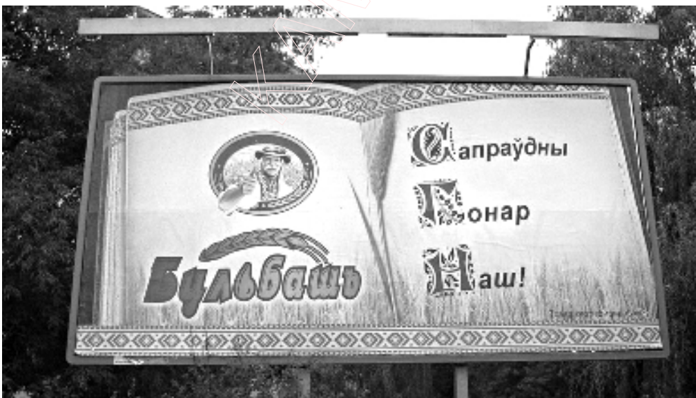
Чым ганарымся? Рэклама гарэлкі і аднайменных чыпсаў. Мінск, верасень 2006 году.