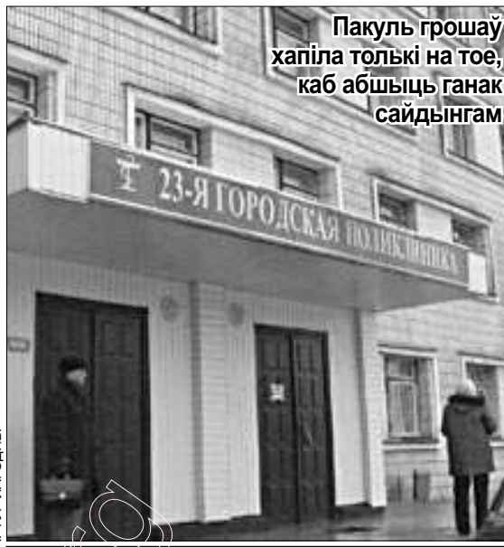
Пакуль грошаў хапіла толькі на тое, каб абшыць ганак сайдынгам