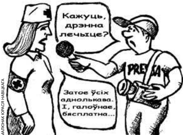
МАЛЮНАК ЮРАСЯ НАВІЦКАГА