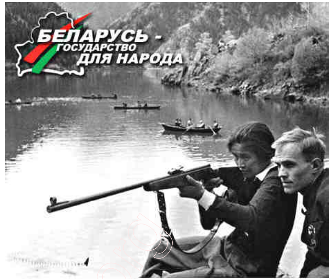
Боевые отряды БРСМ - надежда нации!

Цяпер з’явілася іншая ідэя: зарабляць грошы праз лата-