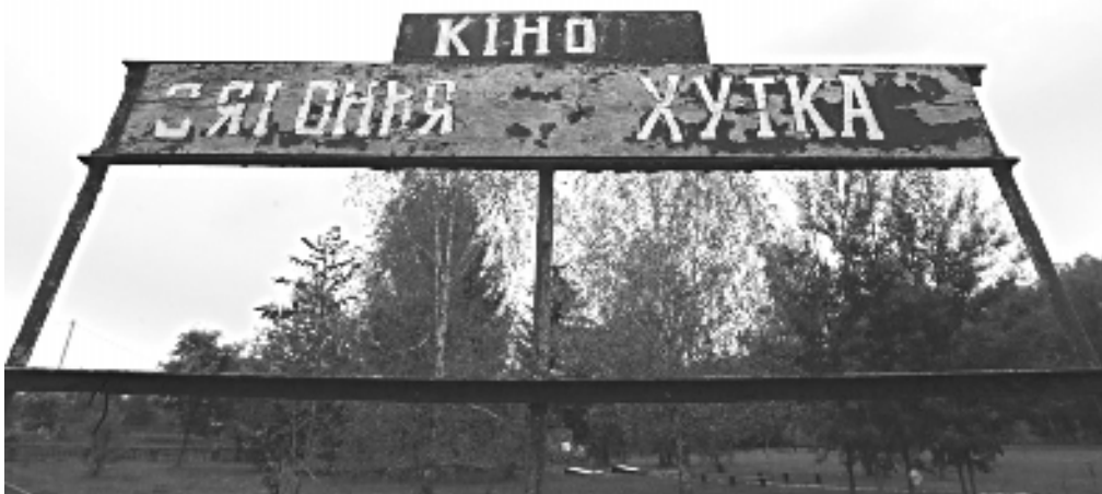
«Сягоння» і заўсёды. Пустая афіша ля сельскага кінатэатра. Гродзенская вобласць. Кастрычнік 2006 году.