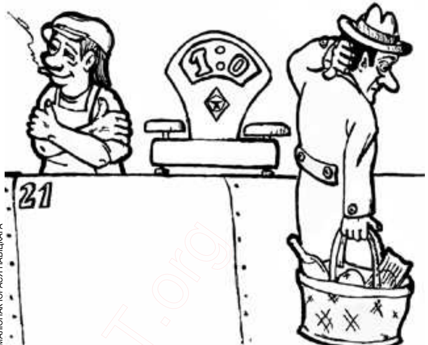
МАЛЮНАК ЮРАСЯ НАВІЦКАГА

Калі Вы набіраеце ў аднаго прадаўца шмат адзнак тавару (рознай гародніны ці садавіны), гандляр праводзіць арыфметычныя аперацыі з касмічнай хуткасцю. Не заўсёды гэта можа быць абумоўлена жаданнем хутка і якасна абслужыць пакупніка. Часам несумленны прадавец можа “памыліцца” ў лічбе на калькулятары на сваю карысць. Таму парада такая: больш чым 2