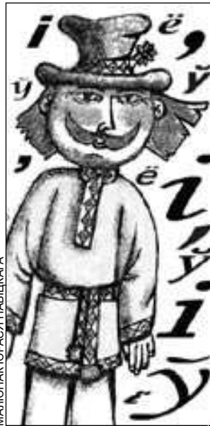
МАЛЮНАК ЮРАСЯ НАВІЦКАГА

— Група была сфарміравана з дзетак трохгадовага ўзросту. У нас ёсць дзве выхавацелькі, якія вядуць гэтую групу. Не выключана фарміраванне дадатковых групаў,