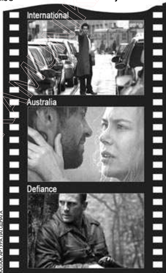
КАЛАЖ АРТУРА ПАГОДНАГА

У калаж таксама трапіў кадр з фільма International , паказ якога ў кіно “Салют” закончыўся.