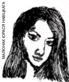
МАЛЮНАК ЮРАСА НАВІЦКАГА

Не сакрэт, што цёплыя дзянькі дазваляюць паненкам апранацца больш лёгка і выглядаць, адпаведна, яшчэ больш прыгожа і прывабна. Цяпер у Вас з’яўляецца шанец падзяліцца сваёй цёплай сонечнай усмешкай з чытачамі газеты