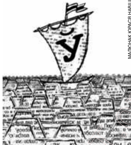
МАЛЮНАК ЮРАСА НАВІЦКАГА

Годам раней мы на запыт беларускамоўных чытачоў ГРУП "Белсаюздрук" адказваў наступным чынам: "...Прадпрыемства клапоціцца пра наяўнасць у рознічным продажы і беларускамоўных выданняў, і іншых тавараў