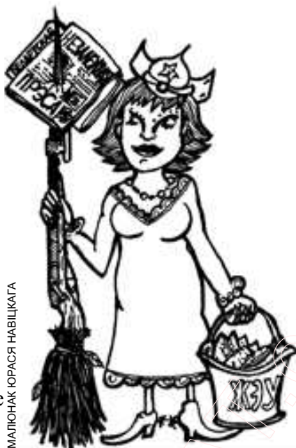
МАЛЮНАК ЮРАСА НАВІЦКАГА

З-за кур’эзнага выпадку жыхары шматпавярховага “слупка” былі пазбаўлены права на атрыманне інфармацыі, якое гарантаванае Канстытуцыяй Беларусі. А інфармацыя была сапраўды цікавая. Большасць артыкулаў нумару датычных менавіта згаданага кварталу Серабранкі. У газеце нашыя карэспандэнты ўзгадалі гісторыю з’яўлення