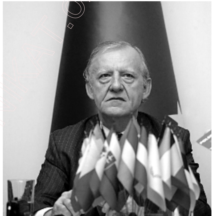
Іен Боўг, кіраўнік прадстаўніцтва Еўракамісіі ў Беларусі і Украіне, падчас прэс-канферэнцыі. Мінск, 21 лістапада 2006 году.

Навіна аб тым, што Еўрапейская камісія (урад Еўрапейскага саюза) рыхтуецца перадаць афіцыйнаму Мінску пасланне, у якім фармулюецца новая палітыка да Беларусі, з'явілася напярэдадні ў панядзелак і стала сапраўднай палітычнай сенсацыяй. Яна адразу выклікала шмат водгукаў – як з боку афіцыйнага Мінска, гэтак і з боку апазіцыі. Старшыня палаты прадстаўнікоў Вадзім Папоў назваў прапанову “палітыкай дыктату” і “вуліцай з аднабаковым рухам”. Лідэры апазіцыі, наадварот, убачылі ў гэтым дэманстрацыю таго, што Беларусі ёсць месца ў сучаснай Еўропе. Аляксандр Мілінкевіч, напрыклад, сказаў у інтэрв’ю Радыё Свабода: “Для цвярозай улады гэта – вялікі шанец для развіцця эканомікі, для вырашэння праблемаў, якія ёсць у Беларусі. Ці скарыстаецца ўлада з гэтага? Яна павінна зразу мець, што дэмакратыя – гэта не проста пажаданне пэўнай часткі насельніцтва нашай краіны, а ўмова ўваходу нашай краіны ў цывілізаваны