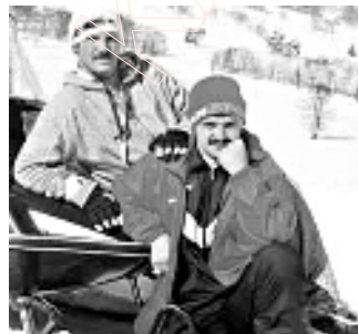
Аляксандр і Віктар Лукашэнкі на зімовым адпачынку.

Аляксандр Лукашэнка разумее, што перадача вышэйшых дзяржаўных паўнамоцтваў сыну — гэта адзінае вы-