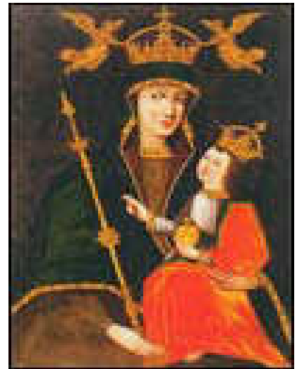
Ікона Маці Божай Бялыніцкай

русі былі зачынены, ў тым ліку Галоўчынскі (1831 г.) і Дудаківіцкі (1847 г.). Бялыніцкі касцёл царскі ўрад вымушаны быў пакінуць, але пры ім ліквідаваўся кляштар. Каталіцкі прыход у Бялынічах за кошт прыхаджан зачыненых касцёлаў значна павялічыўся. У сярэдзіне XIX ст. слава аб Бялыніцкім касцёле і яго цудатворнай іконе набыла найбольшую вядомасць. Сюды ішлі памаліцца не толькі свае прыхаджане, але і многія каталікі Мінскай, Магілёўскай, Смаленскай, Віцебскай губерняў. Частымі наведвальнікамі касцёла былі і праваслаўныя мястэчкоўцы. Касцёл стаў самым вядомым ва ўсёй усходняй частцы Беларусі.