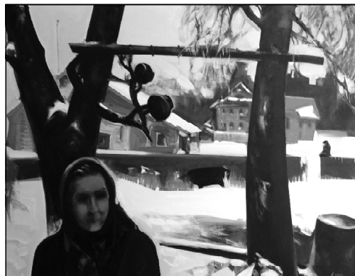
Стары млын у вёсцы Ясьнева.