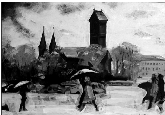
Восень у Менску.

Мне даводзілася бываць у краінах Еўропы, Амерыкі, Азіі і я прыйшоў да высновы, што ў сьвеце паўсюль востра абазначаны нацыянальныя тэндэнцыі ў выяўленчым мастацтве. Самы блізкі мне прыклад – Францыя. Там дамінуе менавіта французскае мастацтва, якія б там ні панавалі плыні і жанры. Ды і ў іншых краінах мастакі бачаць мэту творчасці ў адлюстраванні характару свайго народу. Беларускі мастак павінен імкнуцца да той жа мэты. Бо Беларусь – месца высокай пачуццёвай культуры, непачаты край для таго, каб зрабіць новыя адкрыцці ў людзях.