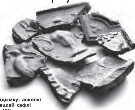
На здымку: аскепі полацкай кафі XIV—XVI ст.