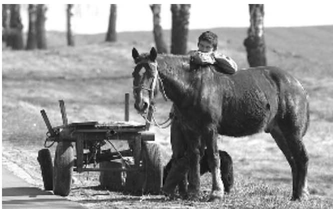
Кола зламалася. Мінская вобласць, травень 2007 году.

15 траўня 1971 году ў Лондане адчынілася беларуская бібліятэка імя Францішка Скарыны – унікальны збор літаратуры з Беларусі і пра Беларусь, роўнага якому няма на Бацькаўшчыне. Кіруе лонданскай бібліятэкай айцец Аляксандр Надсан.