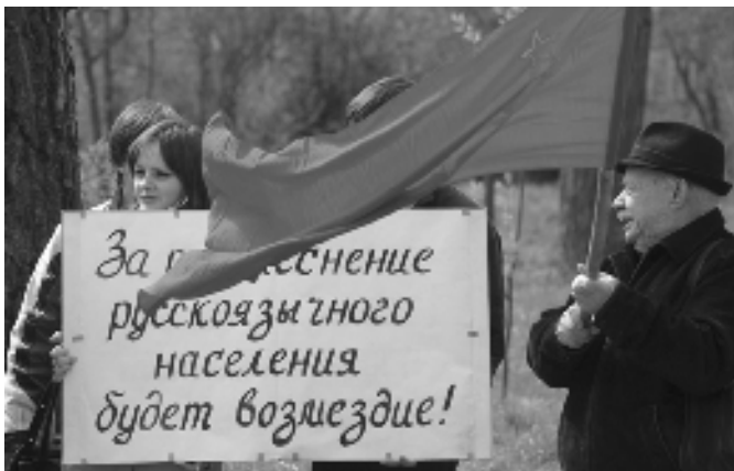
Пікет ля консульства Эстоніі. Мінск, травень 2007 году.