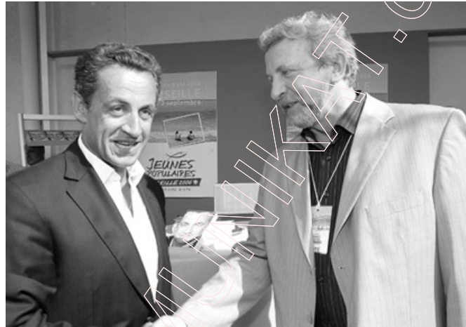
Нікаля Сарказі і Аляксандр Мілінкевіч.

Абодва кандыдаты ў прэзідэнты, што выйшлі ў другі тур (выбары адбыліся 6 траў-