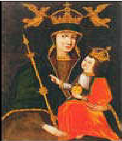
Абраз Маці Боскай Бялыніцкай

Бялыніч свайму вельмі аддаленаму родзічу, крайчаму ВКЛ Крыштофу Сапегу. Пры гэтым апошні атрымаў пажыццёвае права на Бялыніцы, а спадчыннікі маглі выкупіць маёнтак толькі ў яго нашчадкаў. Такое ж пажыццёвае права на Цяцерын было завешчана брату Крыштофа - Яну Фрэдэрыку Сапегу.