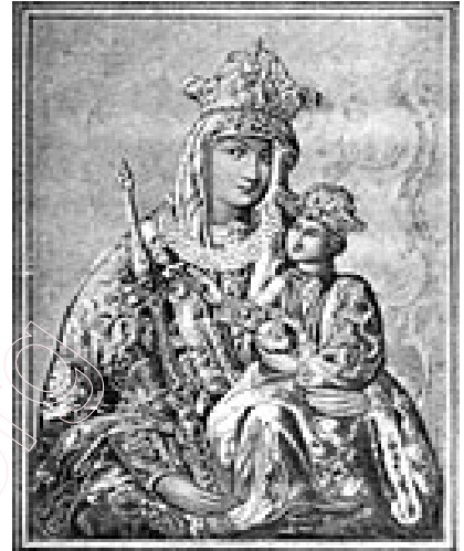
Абраз Маці Божай Бялыніцкай

У гісторыі беларускай літаратуры досыць шырокую вядомасць мае “Гімн да абраза цудоўнай Маткі Боскай Бялыніцкай над Дняпром”, які, паводле меркавання многіх даследчыкаў, належыць пярэпачынальна нацыянальнай літаратуры і актыўнага ўдзельніка нацыянальна-вызвольнага паўстання 1863 года Арцэма Вярыгі-Дарэўскага.