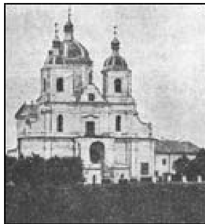
Бялыніцкі манастыр Раства Багародзіцы

Існаваў у мясэчку Бялынічы ў 1877-1918. Утвораны замест зачыненага ў 1877 Мсціслаўскага мужчынскага манастыра. Размяшчаўся ў будынках былога кляштара кармелітаў. Колькасць манахаў дасягала 40 чалавек (пач. 20 ст.). Да Бялыніцкага манастара быў прыпісаны і пазаштатны Мсціслаўскі Тупічаўскі манастыр. У храме захоўваўся цудатворны абраз Маці Боскай, які застаўся ад кармелітаў.