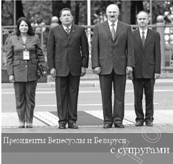
Прэзідэнты Венесуэлы і Беларусі с супругамі

Чавес выступіў са сваімі прапановамі перад Нацыянальным Сходам, усе 167 дэпутатаў якога падтрымліваюць яго палітыку. Прыхільнікі Чавеса таксама кіруюць Вярхоўным Судом, усёй федэральнай бюракратыяй, дзяр-