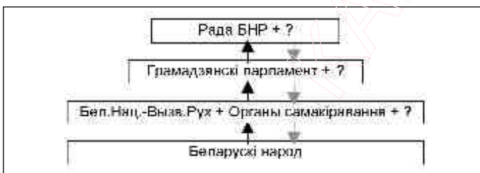
Мал.2. Варыянт структурнай арганізацыі змаганьня за дзяржаўнасць Беларусі з удзелам Рады БНР і НВР.

Нацыянальна-Вызвольнаму руху, які адлюстроўвае сапраўдныя інтарэсы беларускага народу, па лініі „суверэнітэт — анэксіянізм” супрацьстаяць дзве генетычна звязаныя паміж сабой палітычныя сілы: Каляніяльная адміністрацыя і Аб'яднаная псеўдапазыцыя , якія на