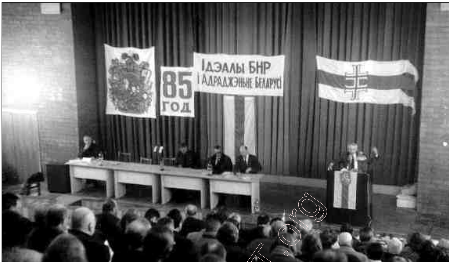
Канфэрэнцыя „Ідэалы БНР і Адраджэньне Беларусі”. Менск, 2003г.

рубля плянуецца, маўляў, толькі з 1 студзеня 2005 г., а таксама за развагамі „экспэртаў” пра выгоду альбо невыгоду ад увядзеньня безнаўнага расейскага рубля рэжым не можа схаваць свае антыдзяржаўныя дзеянні. Беларускі народ рэальна расплочваецца матэрыяльнымі рэсурсамі за антыдзяржаўную палітыку. Пры ўвядзеньні расейскага рубля беларусы дадаткова мусяць аплочваць расейскую карупцыю, войны і ўзбагачэньне алігархаў.