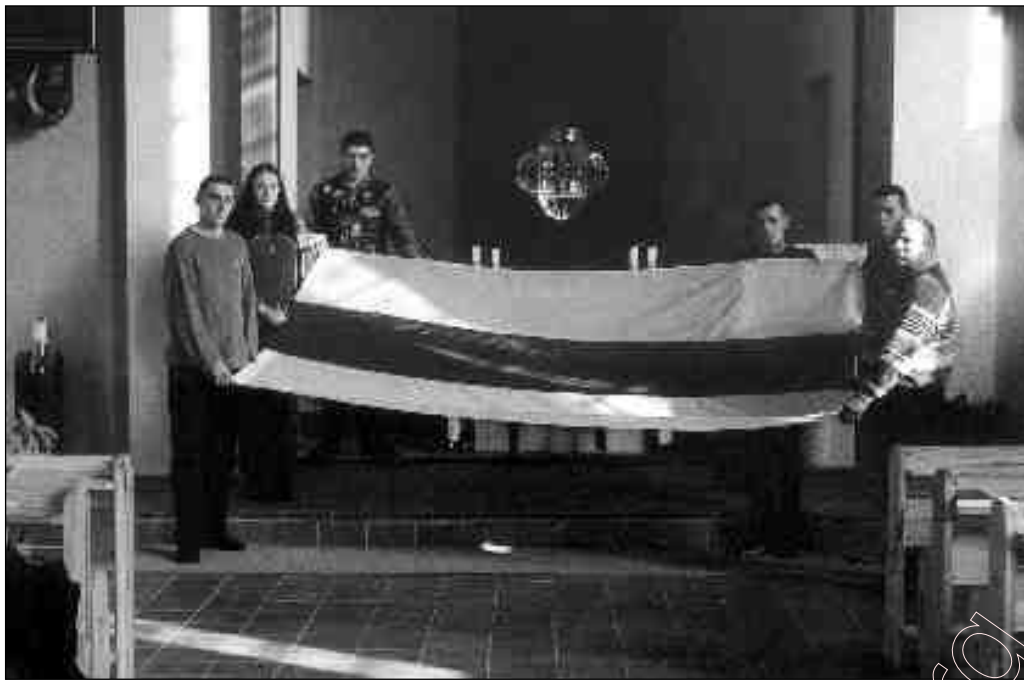
Асьвячэньне Сыюза ў касцёле на Піншчыне.

У час сьмяротнай небясьпекі для нацыі я адчуваю надыход сьветлага Адраджэньня Вялікай Беларусі. Можна, гэта здасца каму неабгрунтаваным, але я не магу не сказаць, што чую ў сваёй душы.