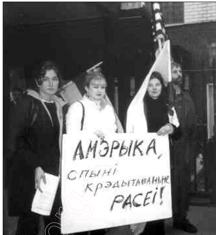
Беларусы ў Нью-Ёрку