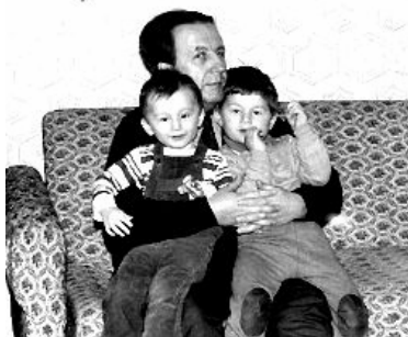
1990 г. Беласток, Аўтар з унукамі.

3 „Ілжэсідараўскі зборнік” папскіх канонаў каталіцкага касцёла, які паўстаў у палове IX ст., дзе знаходзіцца вельмі многа сфабрыкаваных ў Ватыкане фальшывых дакументаў. У ім знаходзіцца таксама „Ілжэдаравальны запіс Канстанціна”. Як падае „Слоўнік Хрысціянскай Царквы” (Оксфорд, Нью Ёрк, 1987, ст.189) ад папы Сільвестра I (памёр у 335 г.) да папы Рыгора II (памёр у 731 г.) зроблена было 35 фальсіфікатаў, якія галоўным чынам прыпісвалі ранні аўтарытэт папы і папскую супрэмацыю. Сапраўды кесар Канстанцін прыняў хрост перад самай смерцю ў 337 г., у Канстанцінополі, калі рымскі папа Сільвестр ужо памёр і хрысціў яго мясцовы епіскап. Папа Сільвестр у Канстанцінополі ніколі не быў, нават не быў запрошаны Канстанцінам Вялікім у 325 г. на першы ўсесяленскі хрысціянскі сабор у Нікею.