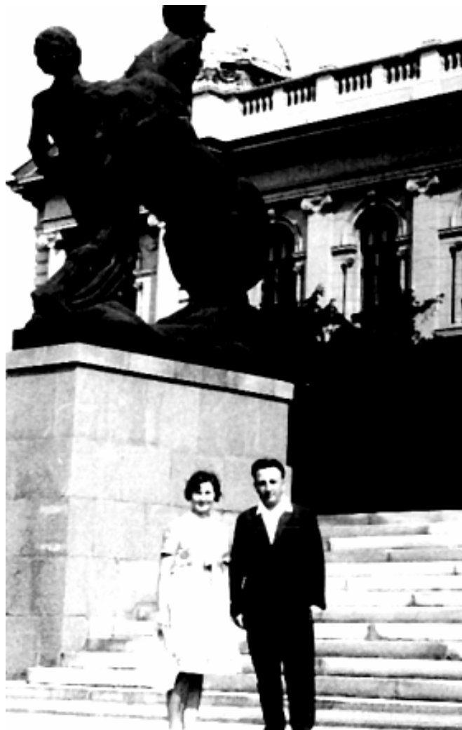
1968 г. Бялград. Жонка аўтара і аўтар перад Скупшчынай.