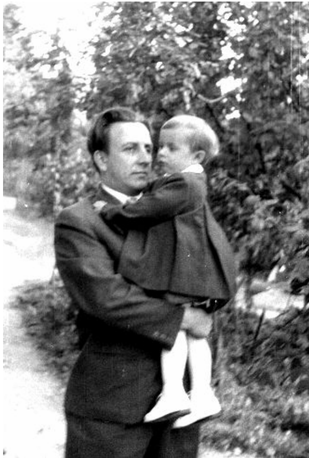
1959 г. Пястуў ля Варшавы. Аўтар з дачкою