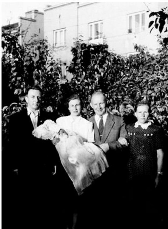
1955 г. Аўтар і жонка з сынам і хросныя сына.

ў Аргенціну, а пасля яго ранення ў Гішпанію пад крыло дыктатара генералісімуса Ф. Франка (1892-1975).