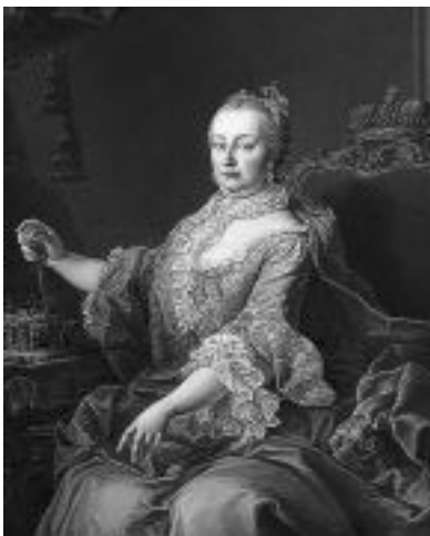
Цэсарова Аўстра-Вугоршчыны Марыя Тэрэзыя – толькі пад ціскам свайго сына Ёзафа II пагадзілася на падзел Рэчыпаспалітай

Аўстрыцкая прэса таксама шмат увагі надавала пазыцыі эўрапейскіх дзяржаваў адносна паўстаньня, асабліва падкрэсьліваючы негатыўную ролю Вялікабрытаніі, Францыі і Прусыі. Пазыцыю Аўстрыі яны разглядалі як спачувальную, грунтоўны