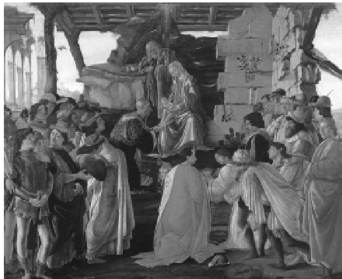
Раней чэсьць належала толькі Пану Езусу, зараз яе аддаюць ідалам гэтага сьвету

Ськлікнуўшы Сабор Папэж абвясціў свой дэвіз: "Aggiornamento", што ў разгорнутым тлумачэньні азначае: дапасаваньне да зменных умоваў сёньняшняга часу! Даноса Кортэз, знаны гішпанскі філэзаф апошняга стагодзьдзя канстатаваў: наш час абцяжараны двума заблуданьнямі 3 . Першае заблуданьне стасуецца да Бога, другое да людзей. Што датычыць першага, то тутакж ёсьць пасягальніцтва на прысутнасьць Бога ў гэтым сьвеце. Ён замяняе хрысьціянскі, біблейскі, традыцыйны вобраз сьвету на дэістычны, на ідэю Бога, які зыйшоў на супакой і кінуў сьвет на адвольнасьць лёсу і ўласнага разьвіцьця. Бо калі Бог зьяўляецца толькі сыстэмай думак, абстрактнай ідэяй і ён не мяшаецца ў жыцьцё канкрэтных асобаў, ані народаў, тады няма якога-кольвек ачалавечанья Бога. Тады няма ані царквы, ані ахвяраваньяў, ані камуніі, ані абвяшчэньня. У такім выпадку гэта толькі культурная зьява. Другое заблуданьне, кажа Даноса Кортэз, датычыць людзей. "Чалавек, - гэтак кажа наш прасьвечаны 4 сучаснік, - добры, лагодны, ён не абцяжараны грахамі, ён прыняты незаплямлены, народжаны незаплямлены. Таму яму непатрэбна выратаваньне, яму патрэбна толькі выхаваньне і выяўленьне добрых задаткаў, закладзеных у ім самім". Чалавек не патрабуе пакуты, самавырачэньня, умярцьвэньня альбо адвагі. Усялякі чалавек вельмі добры, гуманістычны, міралюбівы і ветлы. Гэты пастулят далей быў прыняты ў філізафіі і перад усім сёньняшняй тэалёгіі. У выхаваньні адмаўляюцца ад прынцыпа