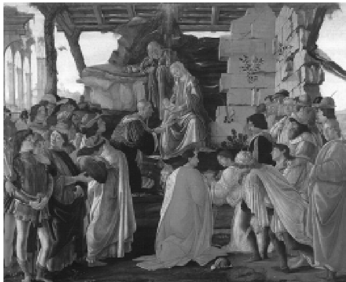
Ranije cześć naleźala tolki Panu Jezusu, zaraz jaje addajuć idalam hetaha światu

Škliknušy Sabor Papież abwiaściú swoj dewiz: «Aggiornamento», szto ú razhornutym tłumaczeńni oznaczaje: dapasawańnie da źmiennych umowaú siońniaszniaha czasu! Donoso Cortes, znany hiszpański filozaf aposzniaha stahodździa konstatawaú: nasz czas abciażarany dwuma zabłudańnia 3 . Pierszaje zabłudańnie stasuje sia da Boha, druhoje da ludziej. Szto datyczyć pierszaha, to tutaka jość pasiahalnictwa na prysutnaś Boha ú hetym świecie. Jon zamianiaje chryścijanski, biblejski, tradycyjny wobraz światu na deistyczny, na ideju Boha, jaki zyjszoú na supakoj i kinuú świat na adwolnaś losu i úłasnaha raźwiccia. Bo kali Boh žjaúlaje sia tolki systemaj dumak, abstraktnej idejaj i jon nie miaszaje sia ú życie konkretnych asobaú, ani narodaú, tady nia ma jakoha-kolwiek aczaławieczañnia Boha. Tady nia ma ani carkowy, ani achwiarawańniaú, ani komunii, ani abwiaszczeńnia. U takim wypadku heta tolki kulturnaja žjawa. Druhoje zabłudańnie, kaža Donoso Cortes, datczya ludziej. «Czaławiek, – hetak kaža nasz prašwieczany 4 suczaśnik, – dobry, łahodny, jon nie abciażarany hrachami, jon pryniaty niezaplamlony, narodźany niezaplamlony. Tamu jamu niepatrebna wyratawańnie, jamu patrebna tolki wychawańnie i wyjaúleńnie dobrych zadatkaú, zakładźenych u im samim». Czaławiek nie patrabuje pakuty, samawyraczeńnia, umiarćwieńnia albo adwahi. Usialaki czaławiek wielmi