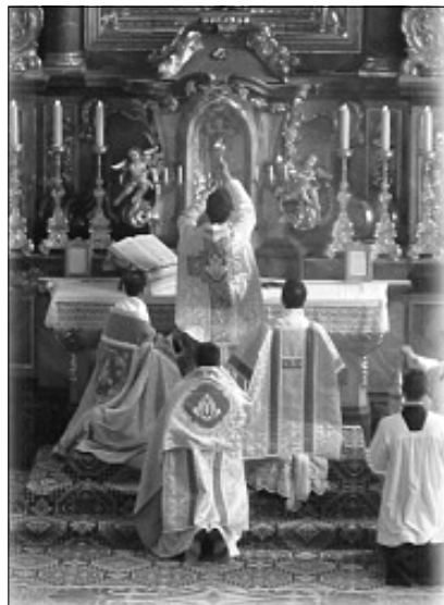
Trydenckaja Imsza – najchwalabniejszy abrad Boskaj Achwiary taksama była addadzena ú achwiaru paśliasabornym reformam

Nareszcie pryszoú czas zrabieć wysnowy: biez pieraadoleńnia modernizmu i jaho prajaúleńniaú u aktualnym nawuczani Kaścioła nie-maźliwa spynić i pieraadoleć katastroficznuju sytuacyju z wyznańiem katolickaj wiery. Modernizm asabliwa niebiaśpieczny ú paraúnańni sa zwyczajnaj herezyjaj tym, szto jon nia maje žorstkich i logicznych pryncypaú, a tamu wielmi ciazka akreślić nakolki modernista jaszczce žjaúlaje sia katolikam, a nakolki nie. Ale adsutnaść hetych pryncypaú i još adchileńnie ad wiery, albo prosta niawierje. Należyć pahladzić praúdzie ú woczy i úreszcie adpawiedna acanić plon II Watykanskaha Saboru, jaki dziakujucy swaim dwuchsensoúnym formuloúkam staú sia swojeasabliwym przykryćciom dla dziejności modernistaú. Usio, szto nie adpawiadaje ichniaj koncepcyi jany nazywajuć «dasabornym» pohladam, kaźucy, szto isnuje bolsz aktualnaje wuczenie. Należyć zaznaczyć, szto ú Kaścioła Katolickaha niama bolsz ci miensz aktualnaha wuczenia, jano zaúždy adno. A kali wynikaje supiarecznaść pa tym ci inszym pytańni, należyć jaho spraućzić na zhodnaść iz cełaj, nieparyúnaj i wiecznaj tradycyjjaj Kaścioła Katolickaha, a nie z heretycznymi formuloúkami dadzienymi ú druhoj pałowie XX stalećcia. Tak dapamazy nam Boh!