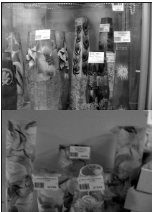
На вітрынах фірмовых магазінаў шклозавода “Нёман”