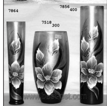
“Прадукцыя” фірмы Бест-Ост

P.S. Невялічкае ўдакладненне: прадукцыя фірмы Бест-Ост прадаецца ва ўсіх фірмовых магазінах шклозавода “Нёман” акрамя самой Бярозаўкі. Пэўна, хацелі “схаваць” ад рабочых гэты факт, каб пазбегнуць некаторых пытанняў?