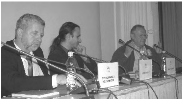
Удзельнікі дыскусіі: Аляксандар Мілінкевіч, мадэратар Любош Вэсэлы, Адам Міхнік

Рэдактар Міхнік успомніў сваё дасведчаньне з часоў дзейнасьці польскай Салідарнасьці, і падаў некаторыя канкрэтныя прапановы, як калішнія польскія мэтады змаганьня супраць дыктатуры можна было-б прымяніць у ўмовах сёньняшняе Беларусі.