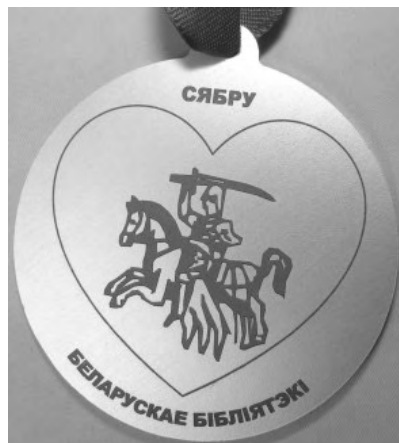
УЗНАГАРОДА за грамадзкую актыўнасьць

... Баявыя дзеянні пачаліся ў лістападзе 1920 г., доўжыліся амаль месяц і былі даволі пасьпяховыя. Аднак тое, што Чырвоная Армія па дамоўленасьці з польскім бокам мела права перасьледаваць ваякаў і на польскім баку, вельмі пашкодзіла змагаром. Актыўнае змаганьне кончылася тым, што случкая брыгада стральцоў перайшла за р. Лань, дзе была раззброеная польскімі ўладамі. Найбольш радыкальныя прыхільнікі барацьбы за незалежнасьць далучыліся да корпусу генэрала Булак-Булаховіча. Партызанская барацьба на Случчыне цягнулася яшчэ да лютага 1921 г.