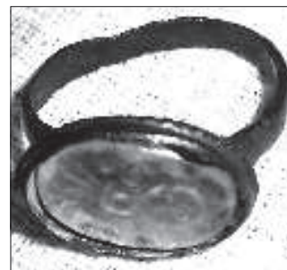
Пячатка гербу «Дарагаслаў» (памер 14×9 мм). У фондах музэя «Пружанскі Палацык»

Чаму найбольш раньня менавіта гэтая гербавая пячатка, якая зараз знаходзіцца ў фондах музэя «Пружанскі Палацык»? Бо дзёве іншыя пячаткі вырабленыя ўжо з каляровага шкла. Трэцяя ж, таксама партрэтная, з празрыстага шкла, яна гэтаксама, як і гербавая, пакладзена на ружовую фарбу, а значыць, блізкая па часе вырабу. Зразумела, калі б тады было каляровае шкло, майстар выкарыстаў бы яго, а не фарбавальную аснову. З даследаваньняў беларускіх вучоных вядома, што даволі складаная і дарагая вытворчасць каляровага шкла ў Беларусі была асвоена з сярэдзіны XVIII стагоддзя. На гэтай падставе можна дапусьціць, што дзёве пячаткі з празрыстым шклом былі выштукаваны да таго, а менавіта да 1750—1760 гадоў, а дзёве з каляровага шкла — крыху пазьней, аднак пры жыцьці аднаго й таго ж майстра, і хутчэй за ўсё нетутэйшага родам, але які жыву і працаваў