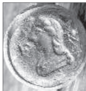
Пячатка з вёскі Козі Брод (d = 9 мм). З фондаў музея «Пружанскі Палацк»

ГКР, што дазваляе меркаваць пра рэлігійныя прыхільнасьці ўласніцы сыгнета да праваслаўя. На сыгнеце з цёмна-блакітнага шкла — выява жанчыны нагадвае грэцкую багіню Ніку — па абодва бакі ад партрэта ініцыялы лацінкаю FR не па законах друку, бо на адбітку яны будуць выглядаць як Я і не поўнае Е. Вельмі цяжка дапусьціць, што пячаткі рэзаліся на шкле. Хутчэй за ўсё, вырабляўся асобны металічны штэмпель, з дапамогай якога на гарачым шкле рабіўся водціск, таму й майстру варта было рэзаць на метале так, як было б і на адбітку пячаткі з воску альбо іншага матэрыялу, — і таму наяўная «памылка» свядомая. Прыкметна, што шырокі каўнер замацаваны брошкаю, а валасы сабраныя ў шырокую касу.