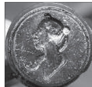
Пячатка з вёскі Лібія (d = 10 мм). З калекцыі аўтара

Трэцяя пячатка, знойдзеная ля вёскі Лібія, зь зялёнага шкла, на ёй няма ініцыялаў, але яна мае іншыя адметнасьці: валасы ня сьплеценыя, а проста сабраныя ў коску, адмыслова перакінутую цераз плячо; прыменена пазалота ў паглыбленьнях; на вуху віднеецца сярэжка; адсутнічае гарнітура. Можна дапусьціць, што гэтая рэч найбольш позьняя па часе вырабу, яна найбольш поўна адпавядае мастацкаму стылю — класіцызму.