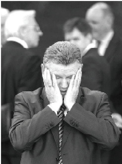
На фото: Министр финансов РБ Андрей Харковец

Белорусское правительство, похоже, постепенно меняет свою тональность по поводу влияния мирового финансового кризиса на отечественную экономику.