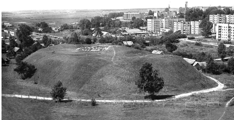
Ил. 1. Копыль. Замковая гора – детинец летописного Копыля. Фото 1997 г. с северо-востока с высоты 25 м.