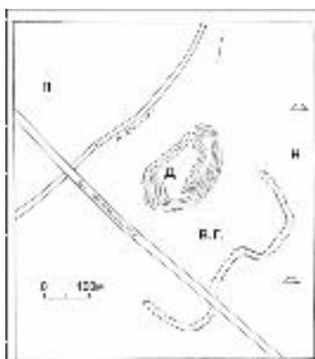
Ил. 2. Ситуационный план исторической топографии Копыля для XII – XIII вв. Д – детинец, с XIV в. – Замок, В.Г. – окольный город, П – посад, Н – некрополь.