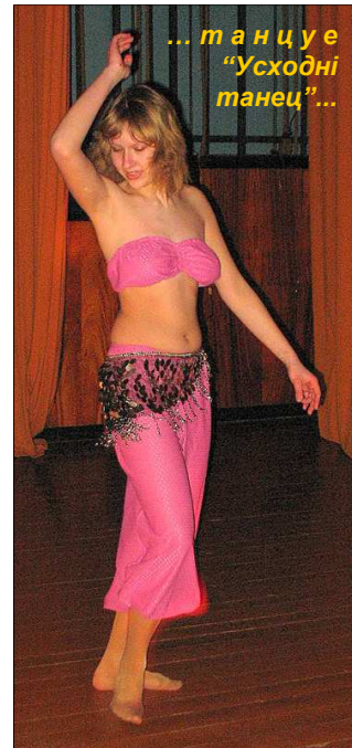
... танцуе “Усходні танец”...