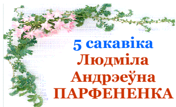
5 сакавіка Людміла Андрэеўна ПАРФЕНЕНКА адзначае 55-годдзе