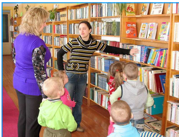
Амаль 10.000 кніг месціцца на гэтых стэлажах...