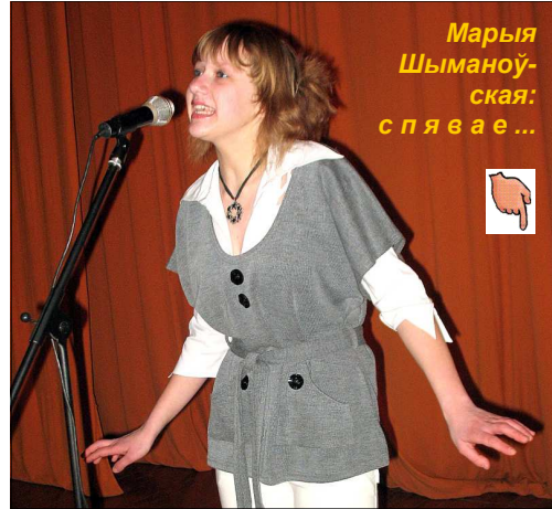
Марыя Шыманоўская: спявае...