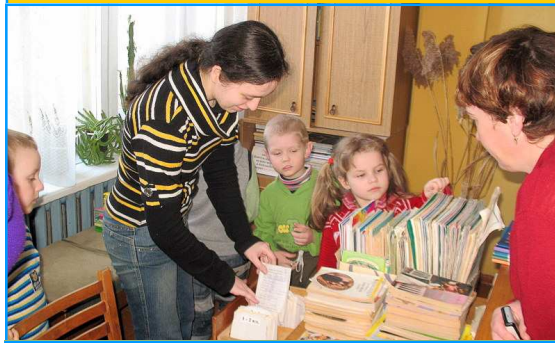
А гэта рабочае месца бібліятэкара