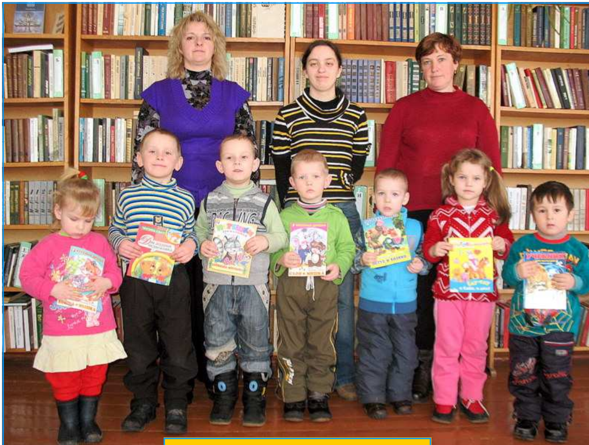
Фотаздымак на ўспамін