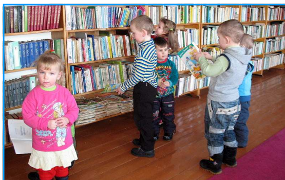
Вось яна якая - бібліятэка!..