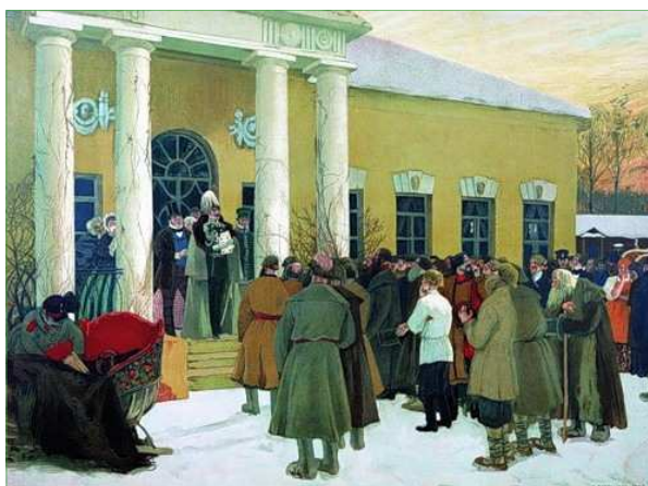
Объявление Манифеста в одной из барских усадеб

ны в размерах земли; они, как правило, получали неудобные для обработки наделы, поскольку самая лучшая земля оставалась у помещиков.