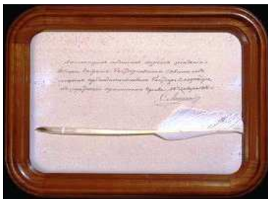
Гусиное перо, которым Александр II подписал журнал заседания Общего собрания Государственного Совета об отмене крепостного права в России

3 марта 2011 года исполняется 150 лет со дня отмены крепостного права в России.